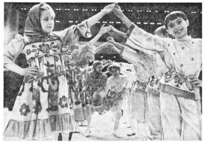
Каникулы — веселая пора

Адрес редакции: 125884, Москва, ул. Правды, 24. Телетайп 207270 Митра. Факс 257 28 26, 257 29 26, 257 29 26.