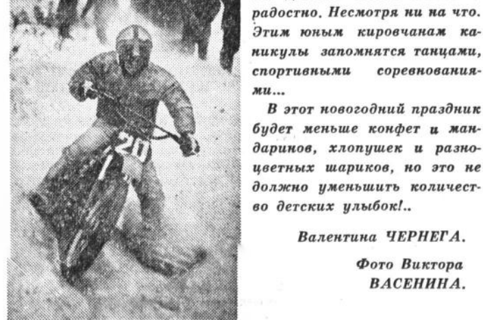
Каникулы! Веселое времячко! Детство всегда светло и радостно.