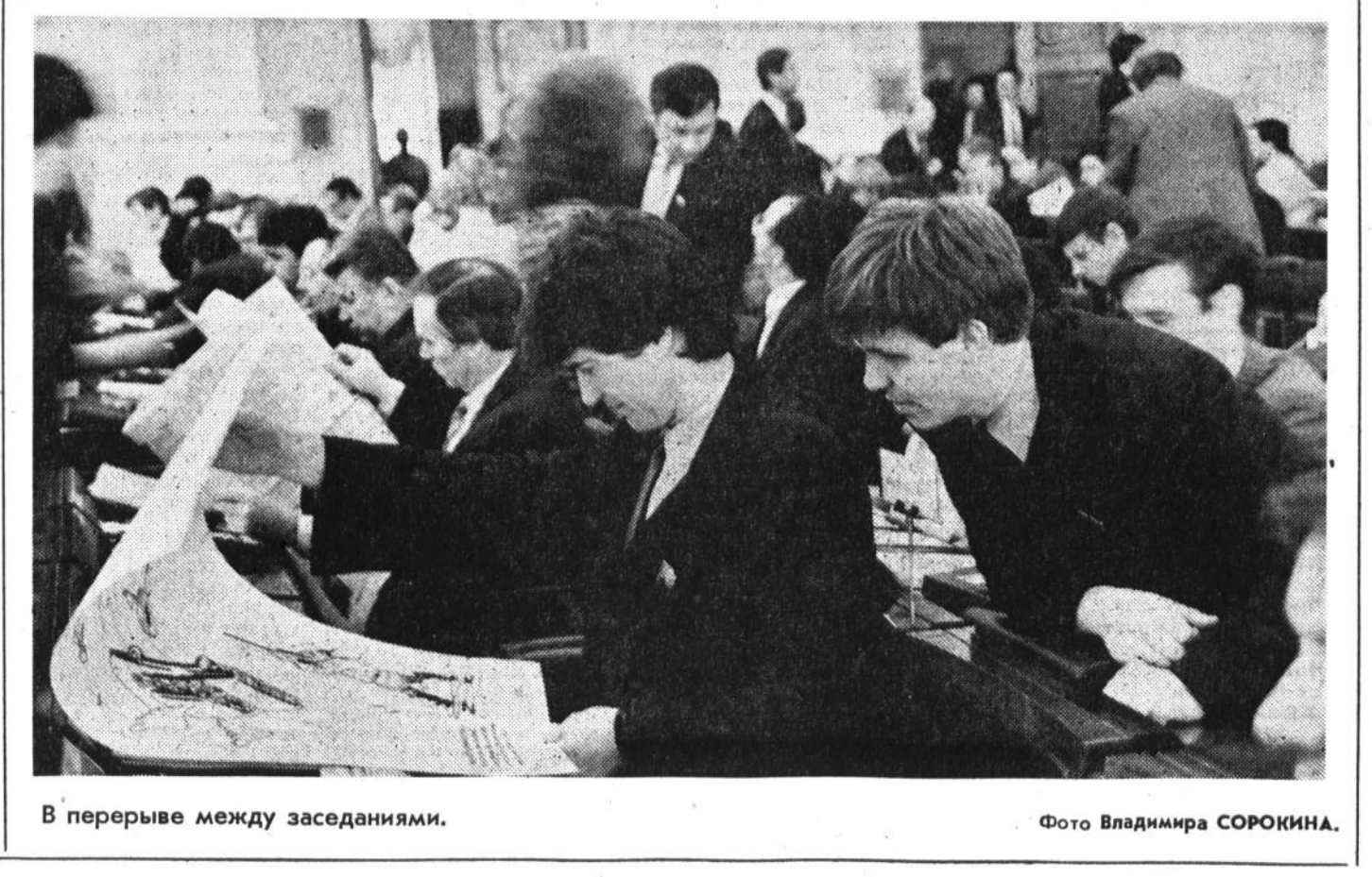
В перерыве между заседаниями.

(Продолжение стенограммы в следующем номере).