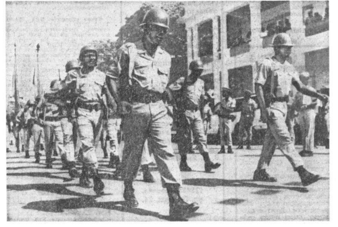
Озабоченность развитием событий в Гаити накануне возвращения на родину 30 октября законно избранного президента Жан-Бертрана Аристиде вынудила специального представителя генерального секретаря ООН Данте Капуто обратиться к видным политикам мира с призывом срочно прибыть в эту страну и принять личное участие в урегулировании гаитянского кризиса, сообщает ИТАР — ТАСС.

уже в начале октября российский Президент направил руководителям ряда ведущих стран блока письмо, в котором выразил тревогу России по поводу его распространения на Восток.