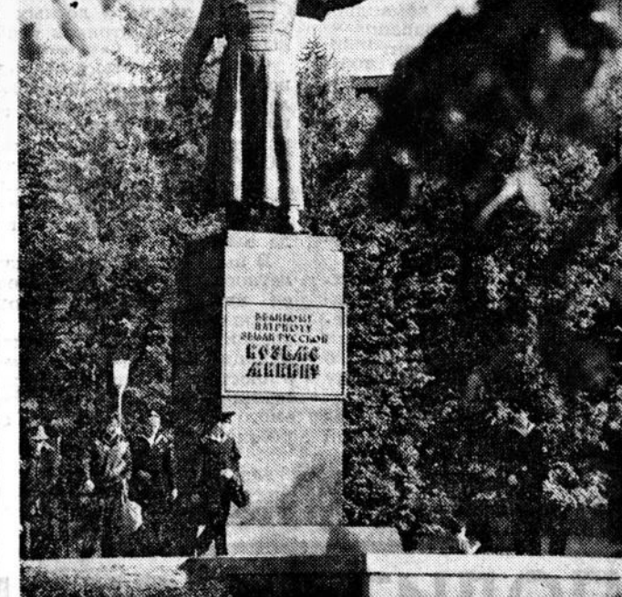
На снимке: памятник Кузьме Минину в Нижнем Новгороде.

В зале музея Нижегородского университета открылась выставка, рассказывающая о событиях 380-летней давности. Король в октябре 1611 года Кузьма Минин, став великим старостой в Нижнем Новгороде, обратился к людям с призывом создать народное ополчение для борьбы с поляками, к тому времени захватившими Москву. В нижегородских архивах в ходе подготовки к выставке обнаружены многие документы, рассказывающие о том, как земляки на протяжении веков старались сохранить память о делах великого нижегородца. Эти документы вошли в экспозицию выставки.