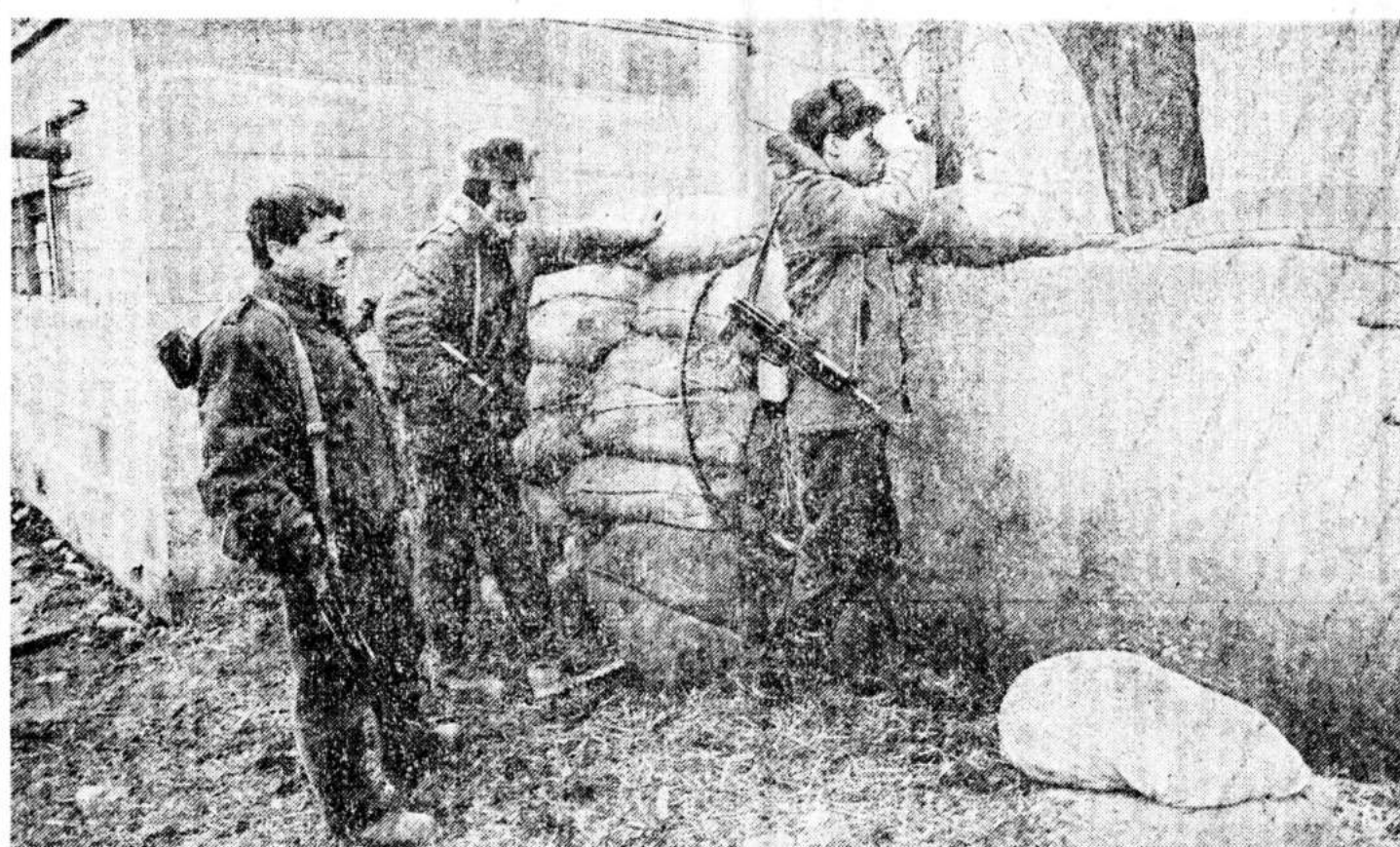
«У нас все качается ночью. У осетин свой арм с малкалиберными винтовками, и ими пристреляна вся территория штаба».