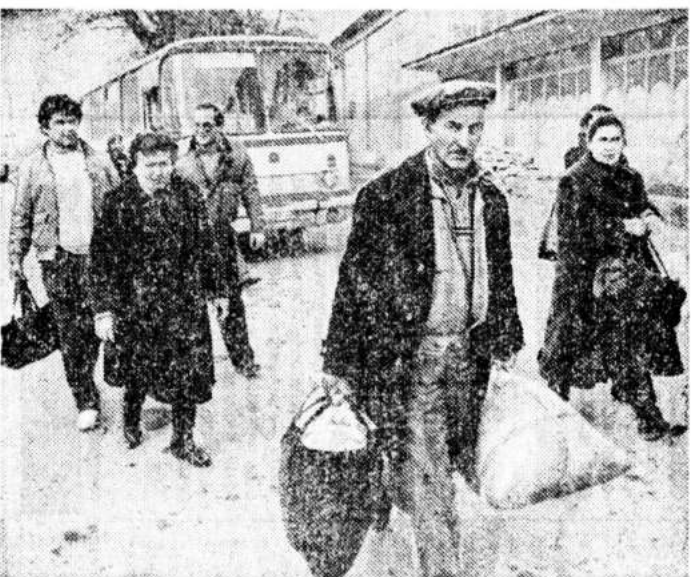
Обе стороны берут заложников. Поэтому лучше не рисковать. Еще одна грузинская семья покинула Цхинвали.