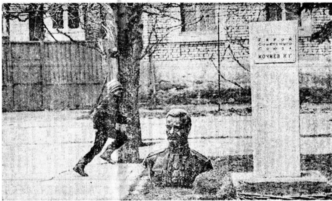
Бюсты осетин Героев Советского Союза были сбиты с постаментов и сброшены в реку в январе, когда во время боя в Цхинвали грузинские вооруженные формирования какое-то время сохраняли за собой центр города. Эта акция вызвала крайнее озлобление осетинского населения. «Чем горше были наши мертвые?» — спрашивают сейчас в Цхинвали. Большинство бюстов удалось поднять и теперь они пока стоят рядом с постаментами, дожидаясь лучших времен. Наступит ли?

Когда ночью в окрестностях Цхинвали грузин и осетины начинают пальнуть друг в друга из автоматического оружия, они враги. Через несколько минут интенсивной стрельбы они перестают быть врагами, но превращаются в мертвецов. И не более того.