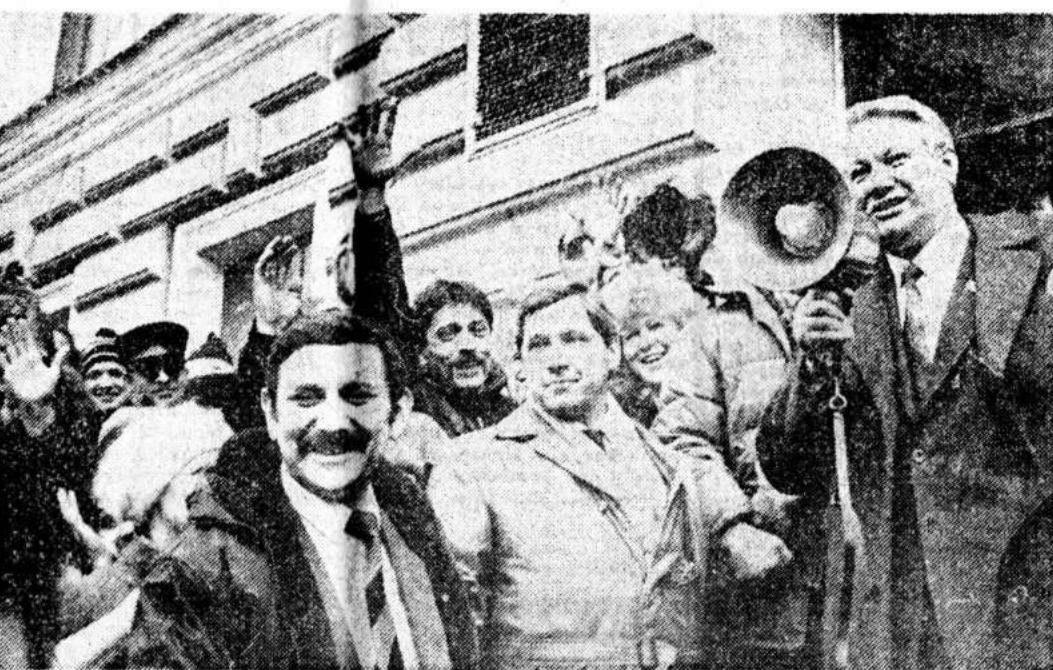
Один из стихийных митингов на заводе.

щественно повысит акции комитетов на предприятии. Водушевили их и беседа при закрытых дверях, где Ельцин выразил признательность за любую поддержку снизу, и фраза, сказанная им на встрече, но совсем по другому поводу: «Колеса такого завода, как Кировский, в ту или другую сторону оказывают влияние на всю Россию». Во всяком случае, предвыборная кампания Б. Н. Ельцина, началом которой можно считать объявление итогов российского референдума, набирает обороты с каждым днем. Так что если чрезвычайный съезд попытается похоронить решение о президентстве, за пределами зала заседания могут возникнуть осложнения, вряд ли непредвиденные.