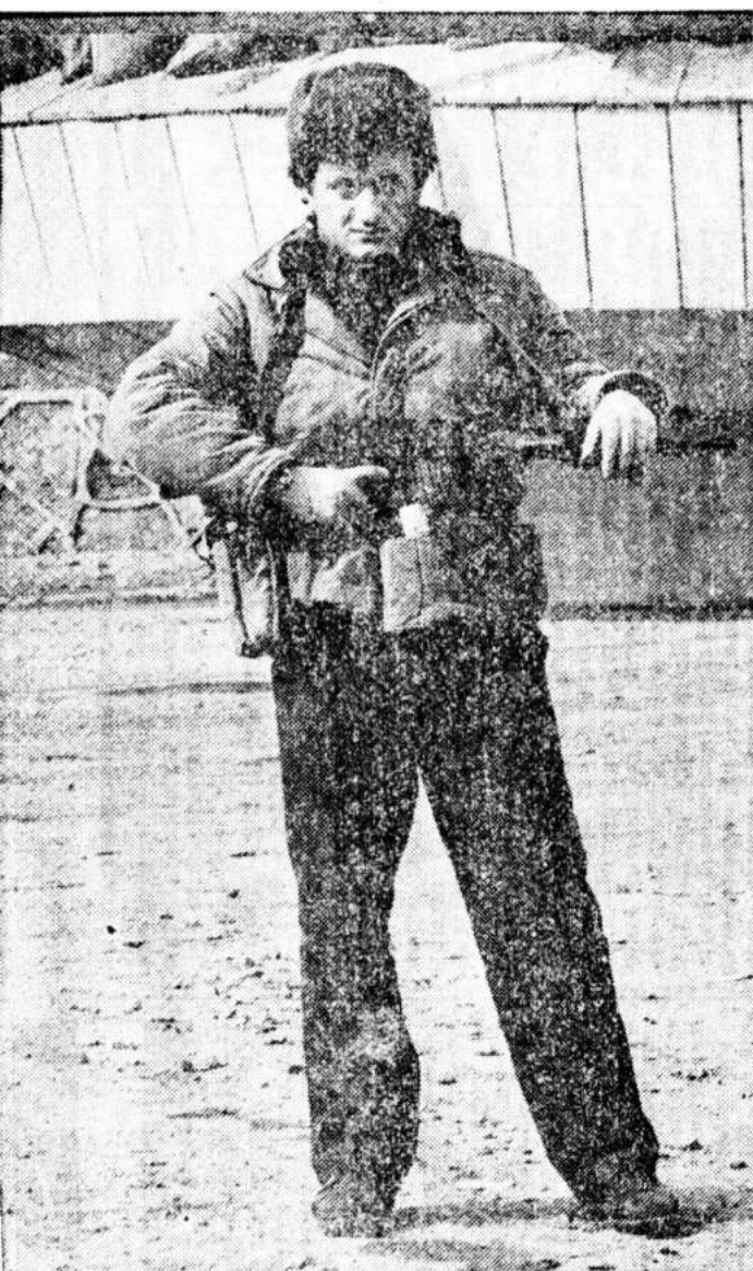
Грузинский автоматчик: «Са-ачабло — наша земля».