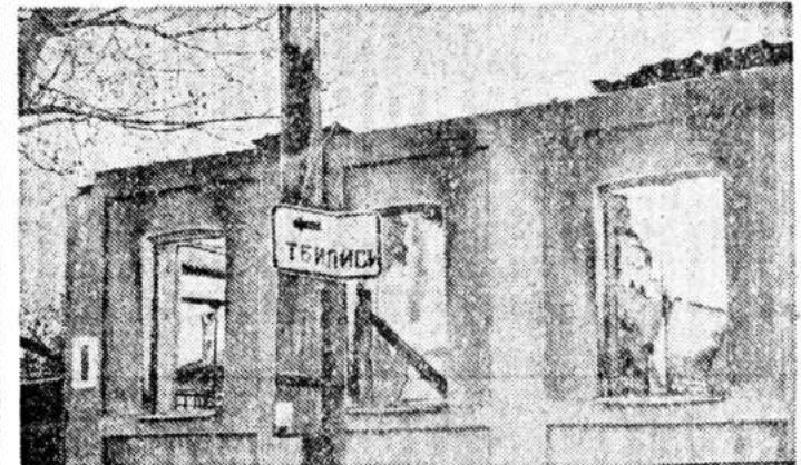
Грузия хочет уйти. Осетины хотят остаться. «Нам с ними не по дороге», — говорят здесь, — и пусть они оставят нас в покое».