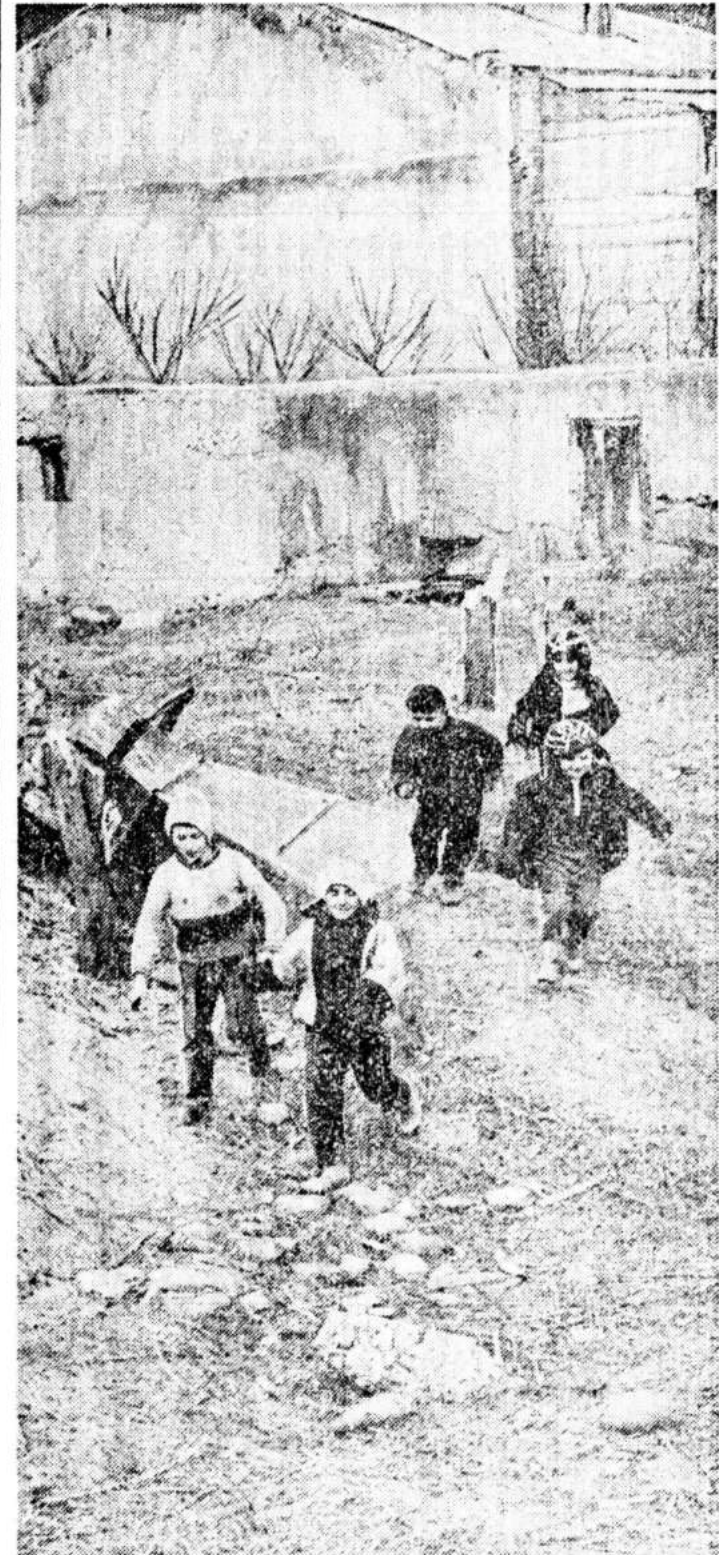
«Мы оттащим из Цхинвали наших женщин и детей, а станет тепло — здесь будет большая крест».