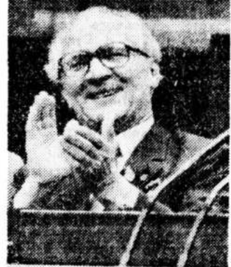
Кто и по чьей команде вывел Хонеккера в Москву?

на выданный Хонеккеру, если таковая будет предоставлена, крайне малы. Тем не менее, заявил Кинкель, Бонн предпримет шаги в отношении Советского Союза в связи с поведением, противоречащим международному праву и заключенным недавно договорам. Что касается международного права, возможности Германии ограничены. Однако она их использует. Договоры между ФРГ и СССР, в частности, недавно подписанный договор об условиях и сроках рыболовства и о выводе советских войск с территории ФРГ — это не договоры между банановыми республиками. Действия Москвы ставят возможность наказания Хонеккера под угрозу срыва. Хонеккер должен быть передан обратно. Кинкель и Фогель подчеркнули, что Советский Союз своими молниеносными действиями хотел выдать Хонеккера Бонну перед свершившимся фактом.