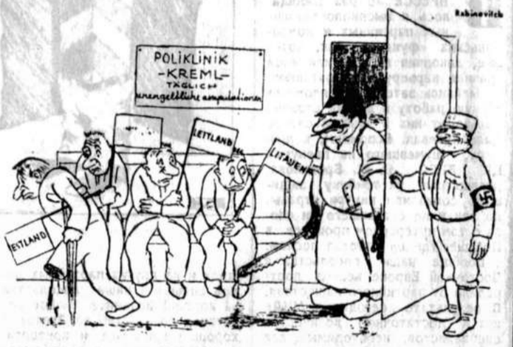
„Der nächste Herr bitte!“

«Пролу, слугующий!» — карикатура из швейцарского сатирического журнала «Небешлаггер», октябрь 1939 г. На вывеске написано: «Полкампания Кремль. Аппурация проворует еженежно и бесплатно».