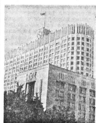
Парламентский обозреватель «РГ» передает из Белого дома

На утреннем заседании 25 ноября, проходившем под председательством Руслана Хасбулатова, продолжалось обсуждение проекта Закона «О внесении изменений и дополнений в Конституцию (Основной Закон) Российской Федерации».