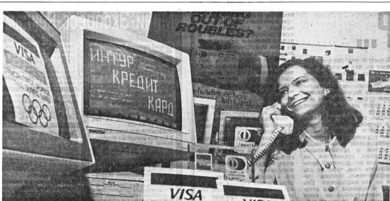
В компьютерном центре.