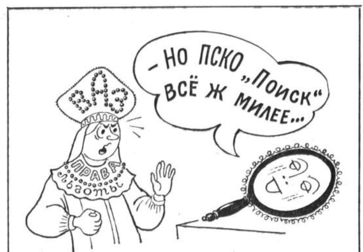
Рисунок Марка Каширина.

строительство рабочей силой и техникой. «Лада-банк» — профинансировать проект, а третий партнер — американская строительная фирма — поставить свои технологии и полуфабрикаты коттеджей. Министерство обороны и Приволжско-Уральский военный округ должны были выкупить готовые коттеджи. А Приморский поссовет в результате этой программы получал десять процентов построенного жилья: этого хватало бы на благоустройство домов всех жителей поселка, и еще останется на продажу или сдачу в аренду с выгодой для поселкового бюджета.