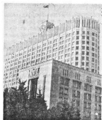
Парламентский обозреватель «Российской газеты» передает из Белого дома.