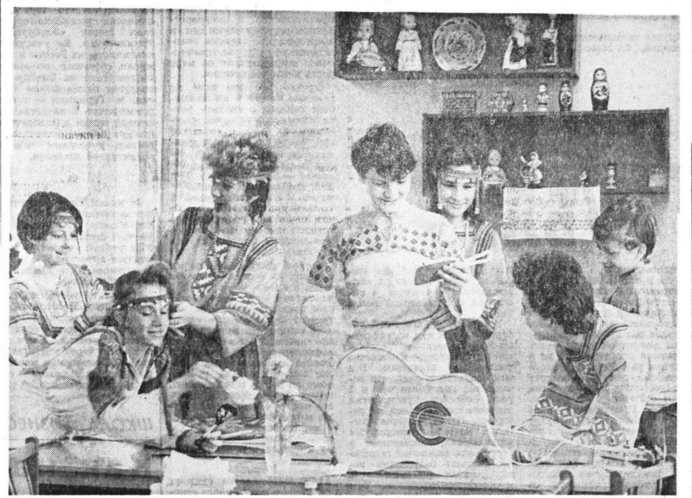
В экспедицию за народными песнями и преданиями собираются отправиться члены фольклорного ансамбля «Танок»...