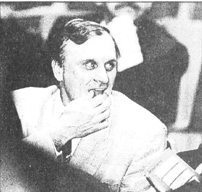
Центр и края. Соединятся или будут биться до последнего?