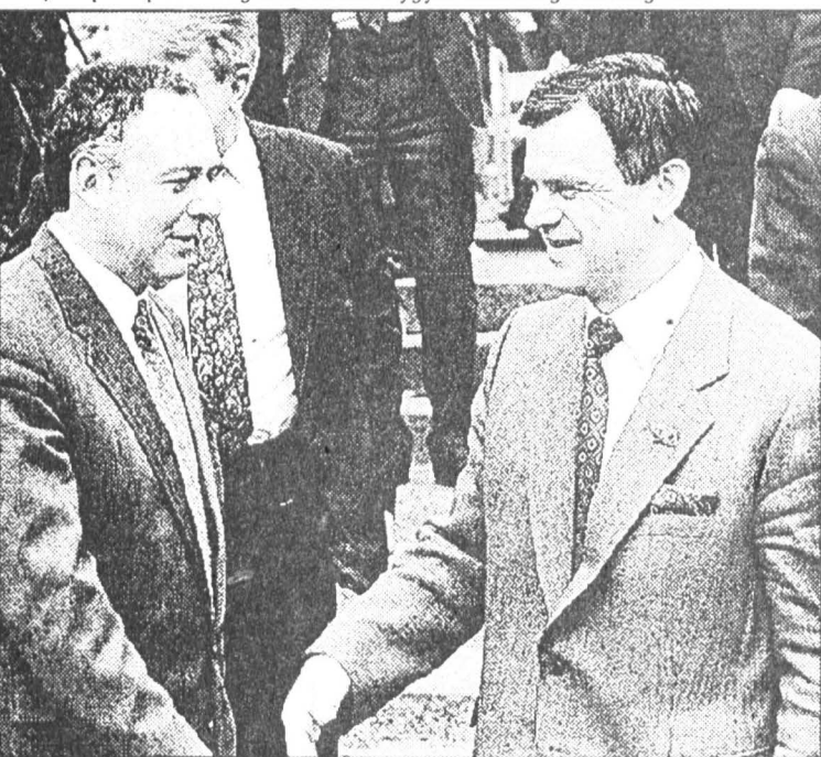
Раскол. Когда-то вместе — сегодня «победители» и «побежденные». Во имя чего?