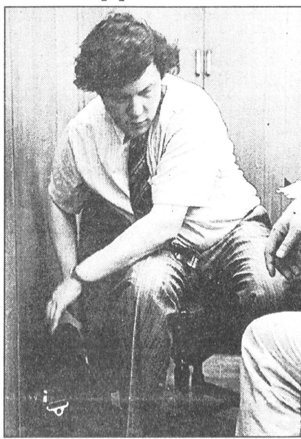
Будущие президенты России? Каждый сам по себе, но каждый вселяет надежду.