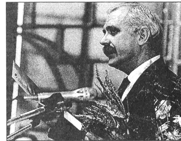
Никита Михалков — приз за лучшую режиссерскую работу (фильм «Урга. Территория любви»).