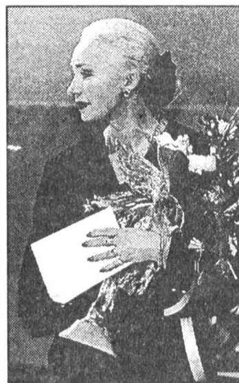
Татьяна Васильева — лучшая женская роль (фильм «Увидеть Париж и умереть»).