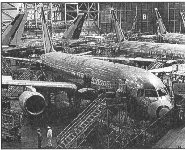
Цех сборки в городе Эверетт.

Правда, они признаются, что боее или менее точный прогноз ситуации крайне затруднен по причине высокой политической и экономической нестабильности этого региона. При этом аналитики «Боинга» категоричны в одном: не следует ожидать улу-