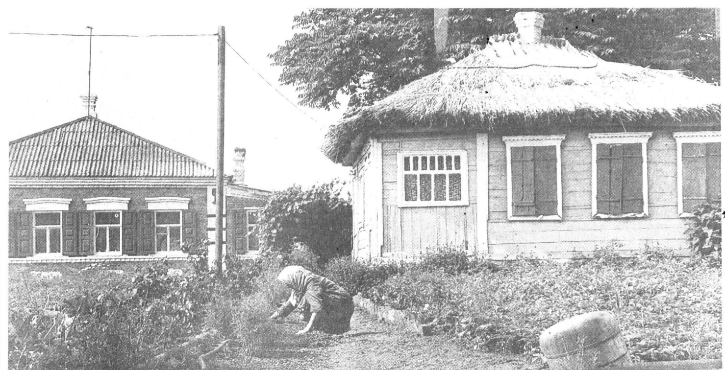
Казачье подворье на хуторе Усть-Койсуг в Ростовской области.