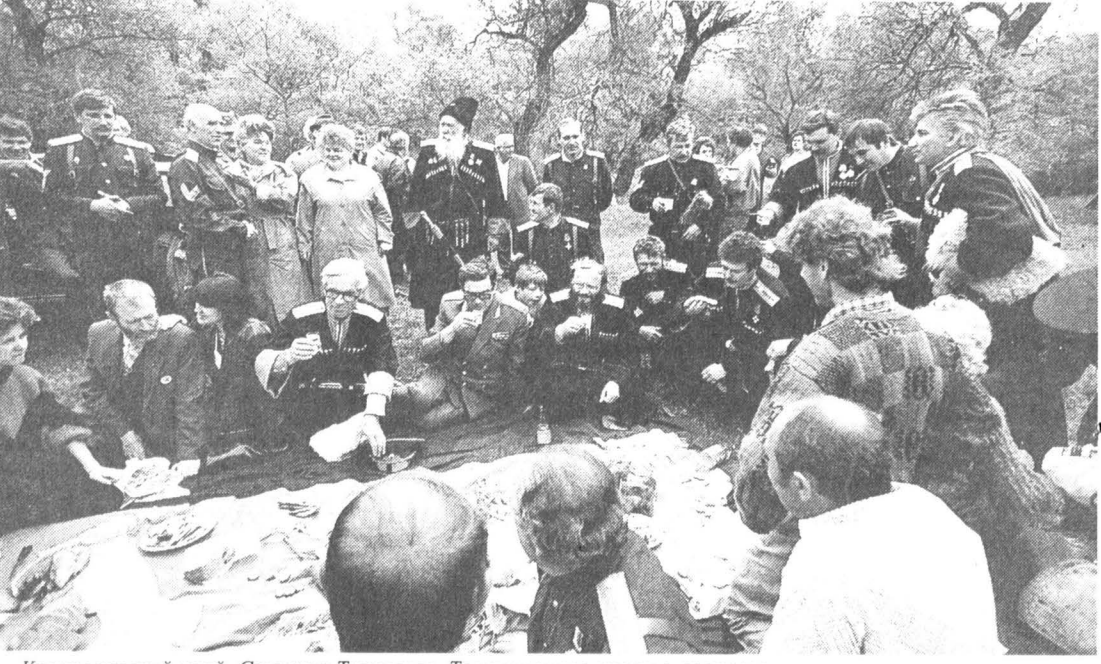
Краснодарский край. Станица Тиховская. Традиционное казачье застолье.

Казачество давно уже не удовлетворено ролью культурно-этнографического феномена, несмотря на присутствие в одежде внешне архаического антуража (почему-то из всех существовавших традиционных костюмов они предпочи-