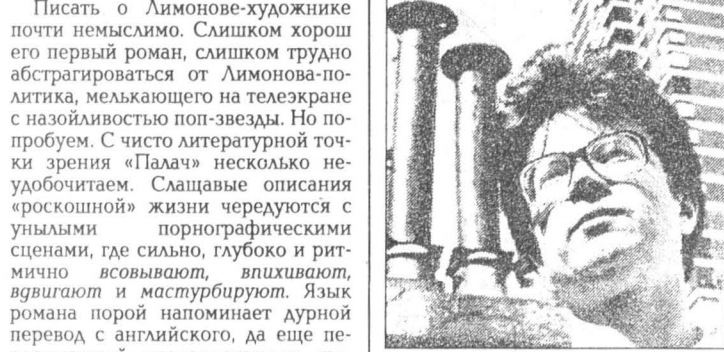
Эдуард Лимонов. Палач. Роман. М.: «Глагол», 1993.

Писать о Лимонове-художнике почти невозможно. Слишком хорошо его первый роман, слишком трудно абстрагироваться от Лимонова-политика, мелькающего на телеэкране с назойливостью поп-звезды. Но попробуем. С чисто литературной точки зрения «Палач» несколько неудачно. Славные описания «роскошной» жизни чередуются с унылыми порнографическими сценами, где сильно, глубоко и ритмично используются, влияющие на ритм и структуру повествования, язык романа порой напоминает дурной перевод с английского, да еще перешагивая всевозможными типичными, гаррами, лофтами и прочими парти. И говорят так не только эмигранты, что объяснимо, но и природные американцы. Нет, я понимаю, что это такой специальный