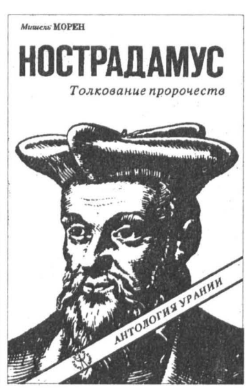
Мишель Морен. Нострадамус: толкование пророчества. Серия «Антология Уралия», М., Уралия, 1993, тираж 20 тыс. экз.

МЕЖДУ мирами граница тоньше лезвия бритвы. По этой стезе несешься вымысленным конем и взбрыкиваешь ногами, хрипя от натуры и плача человеческими слезами о безмерной скорости жизни. Чуть остановишься, размышляя, во имя чего бешеная гонка, — и истечешь кровью, разрезанный неполамом, исчезнешь, частью в мире обывательском-реальном, частью — в призрачной дырке небытия, где связь расторгнута, если угодно, в мире фантомов и сновидений. Что же это было? Картины будущего, отдаленные сотнями лет, заставляющие дрогнуть что-то в глубине подсознания и радующие тем, что их никогда не удастся пережить. Или божеественное откровение, ре-