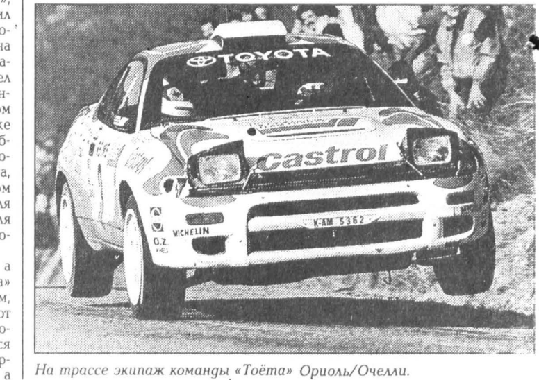
На трассе экипаж команды «Тоёта» Ориола/Очеллаи.

сделает оставшиеся этапы чемпионата мира интересным и возбуждающим зрелищем.