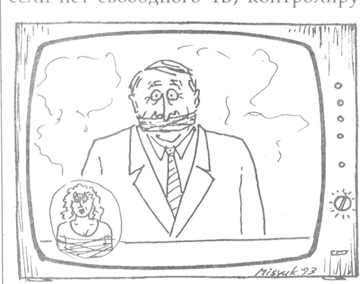
Рисунок Вагима Мускова.

полномочия, чтобы, как они говорят, огрести президента от «нежелательного ТВ».