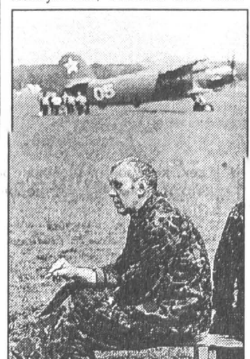
Внимательный инструктор всегда готов прийти на помощь.

Но даже вечность полета когда-то заканчивается, и о том, что пора готовиться к посадке, напомнит усилившийся у земли ветер. Предназначенный для новичков парашют, по мнению профессиональных спортсменов, спускается с черепашьей скоростью, но и ее вполне достаточно, чтобы весьма чувствительно тряхнуть зазевавшегося об землю. Поэтому лучше уже не отвлекаться, а сгруппировавшись и сведя стопы, как учили, встретить землю во всеоружии. И первое, что вы сделаете, когда купол парашюта бесшумно распластается у ваших ног, — с завытием посмотрите на тех, кто еще парит в вышине. Ибо с этой минуты небо приняло вас, а вы — оно.