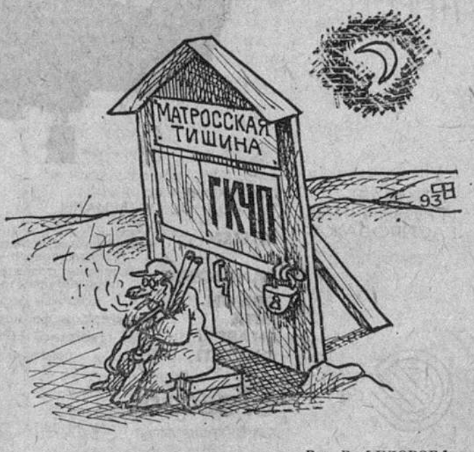
Рис. В. ФЕДОРОВА.