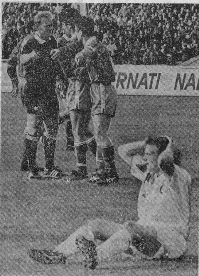
На снимке: момент игры сборных России и Греции.

Матч этот получился трудным для российской сборной. Соперник оказался неуступчивым и достаточно квалифицированным. Давно у греков мы не видели такой хорошей команды, сбалансированной во всех линиях.