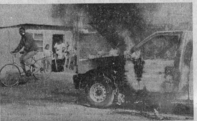
В пригороде Йоханнесбурга Соуэто продолжаются беспорядки, вызванные введенным полицией запретом на участие студентов в массовых манифестациях.

Об этом было объявлено после встречи в Кейптауне Б. Макдугал с президентом ЮАР Ф. де Клерком. Канада также готова направить на выборы своих наблюдателей.