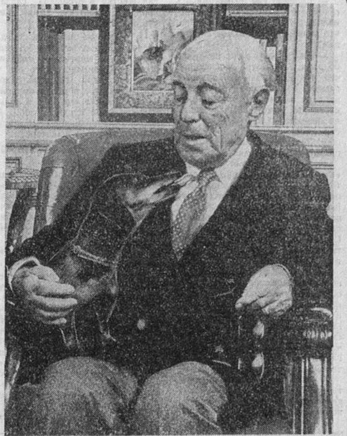
Конечно, нет. Самым большим несчастьем для меня было бы отсутствие семьи и друзей...