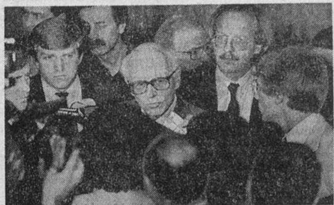
21 мая Андрею Дмитриевичу САХАРОВУ исполнилось бы 72 года (по календарю православной церкви это, кстати, день Иоанна Богослова, апостола и евангелиста).

«Сахаровское наследие и судьбы России в мире» — так называется статья министра иностранных дел Российской Федерации Андрея КОЗЫРЕВА, предложенная нам нашей газетой для опубликования в этот день.