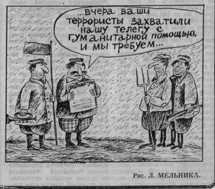
Рис. Л. МЕЛЬНИКА.

ДОКОПАЛИСЬ... Попытку побега из исправительно-трудового учреждения, расположенного в Башкортостане, предприняла группа осужденных. Много дней скрытно прокладывался тоннель, но «землекопы» ошиблись в расчетах — лав не вывел их за пределы колонии. Они выбрались на поверхность земли прямо у колодезя проволочки, и охранники, обнаружив их, вынуждены были открыть огонь. Один из беглецов-неудачников был смертельно ранен, остальные задержаны. Александр ЗИНОВЬЕВ (Уфа), журналист.