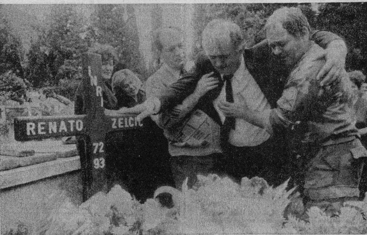
Родители хорватского солдата прощаются со своим двадцатилетним сыном. Он погиб в ходе столкновений хорватов с мусульманскими воинскими формированиями в Боснии. В течение последней недели в результате боев между этими бывшими союзниками в Боснии убиты десятки солдат.