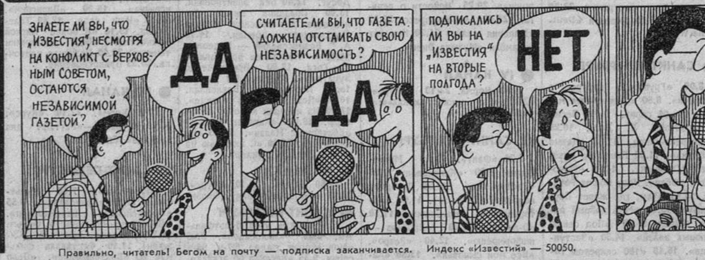
Правильно, читатели! Бегом на почту - подписка заканчивается. Индекс «Известия» - 50050.