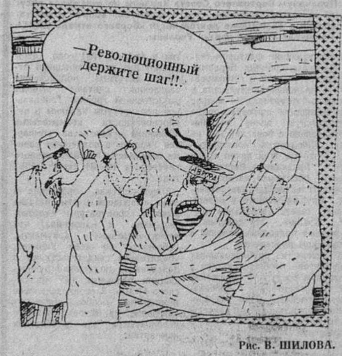
Рис. В. ШИЛОВА.