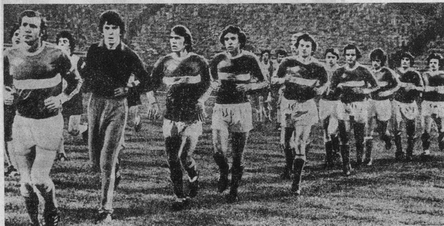
...и пусть читатели сами назовут имена кумиров прошлого