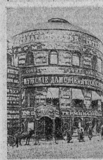
Тверская улица в Москве в 10-е гг. XX века. Архивный снимок.