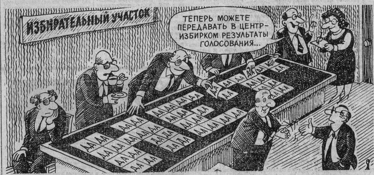
Рисунок Валентина РОЗАПЦЕВА.

ложением «плана действий» президента, который якобы начнет осуществляться в ночь на 26 апреля. МБР поручено направить результаты проверки этих утверждений в Генеральную прокуратуру для принятия мер. Соб. инф.