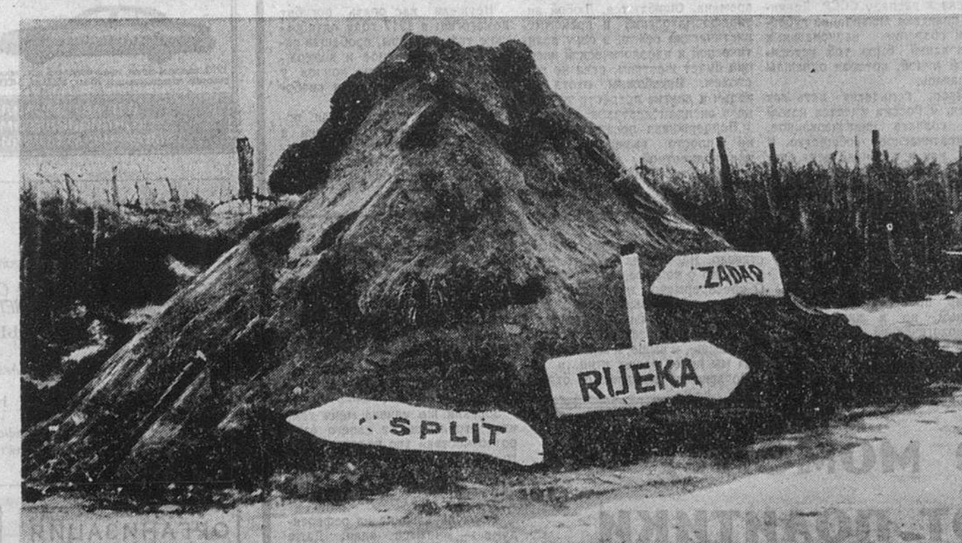
Разбитый дорожный указатель в районе боев на Масленице. Иностранные туристы, приносившие Хорватии 3 миллиарда долларов в год, не скоро вернутся на всемирно известные курорты Адриатического побережья — Задар, Ријеку, Сплит.