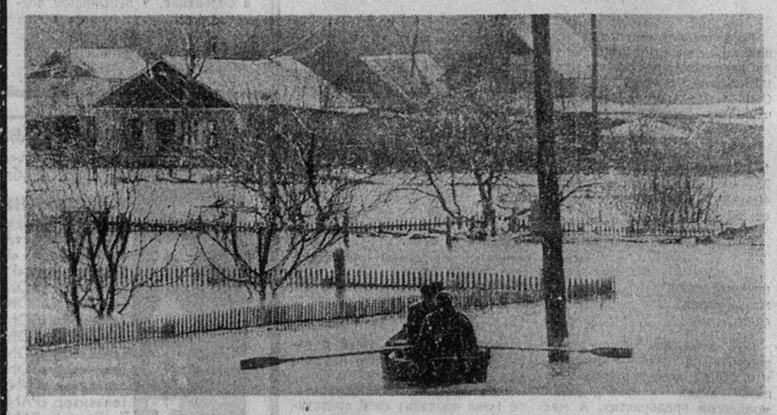
Поселок Кузнецкий под Оренбургом оказался по весне затопленным из-за нагромождения современных зауряд.

Сообщает Росгидрометцентр С каждым днем на южной территории России усиливается свое влияние область высокого атмосферного давления. Это приводит к тому, что в субботу и воскресенье в большинстве районов будет сухо. Прекратятся осадки в Поволжье и на Северном Кавказе, где они шли в течение нескольких последних дней. Температура в основном будет ровной ночью от 1 до 8 градусов тепла в Волго-Вятском районе, на Средней и Нижней Волге возможны слабые заморозки а днем — 12—13 градусов. Зона непогоды с циклоном уйдет за Урал и сосредоточится над югом Урала, в