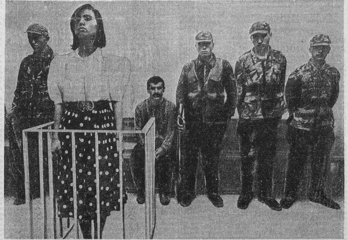
Эту женщину обвинили в том, что она боролась за независимый Курдистан. Приговор суда — 12,5 лет тюрьмы.

Калат Дияз был крупным торговым городом недалеко от границы с Ираном. Дух свободы, царивший в нем, раздражал иракских военных, поэтому они с помощью бульдозеров и взрывчатки сровняли его с землей, предварительно выселив жителей — около 70 тысяч человек. Но даже эта история меркнет перед трагедией Халабджи, которая для курдов означает примерно то же, что для евреев — варшавское гетто, а для басков — Герника. Поселок Халабджи обрел известность 16 марта 1988 года, когда был полностью уничтожен иракскими