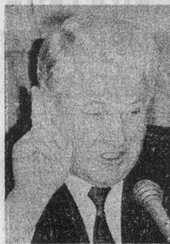
Накануне всероссийского референдума 25 апреля я, как Президент Российской Федерации, представляю народу проект новой российской Конституции, который стал результатом кропотливой работы по соединению лучшего, что было представлено в проектах Конституционной Комиссии, Президента Российской Федерации и многочисленных инициативных рабочих групп. Предлагаемый проект — с одной стороны, плод длительной коллективной работы, а с другой стороны — принципиальная позиция Президента.

Президент Российской Федерации знакомит с основными принципами новой Конституции Российской Федерации. В ближайшее время полный текст Конституции будет направлен руководителям республик, краев, областей и автономных округов, городам Москве и Санкт-Петербургу и после этого опубликован.