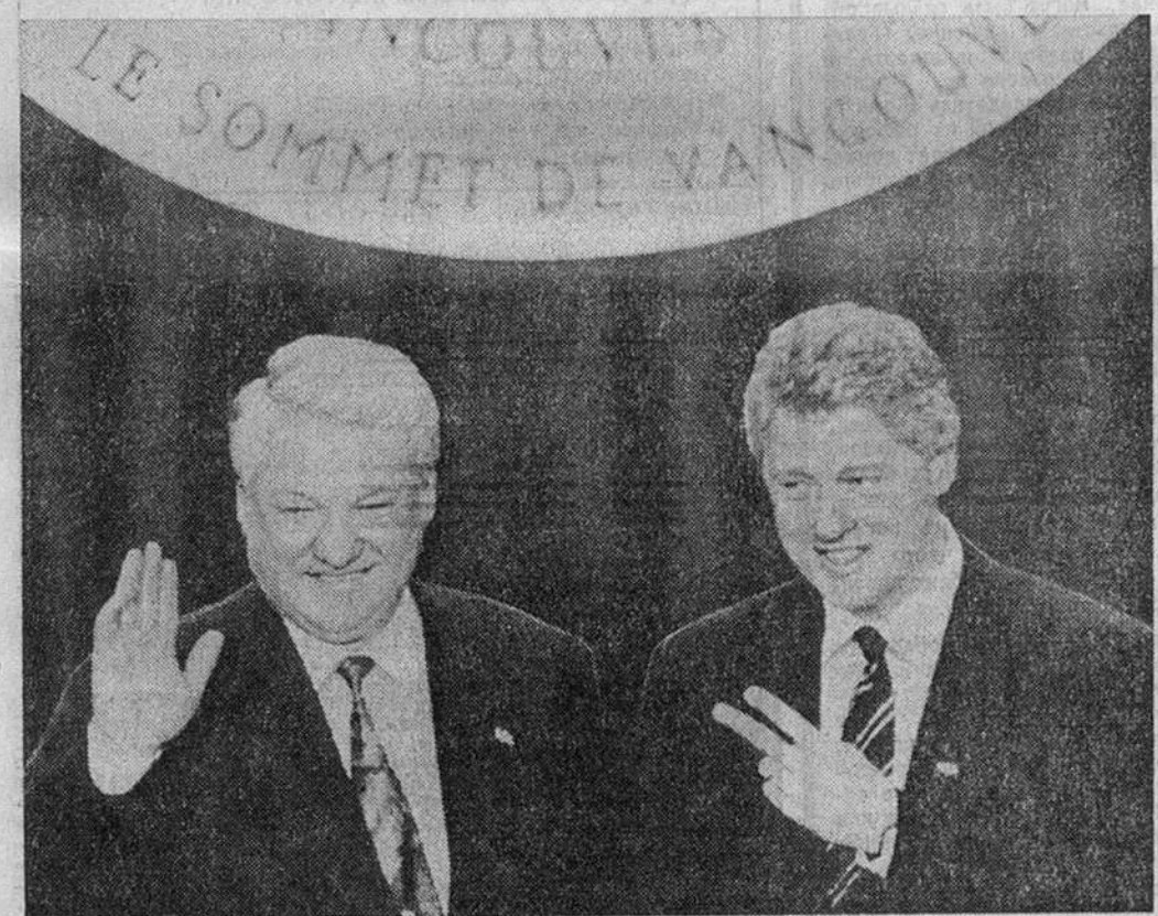
Б. Ельцин и Б. Клинтон после совместной пресс-конференции 4 апреля.