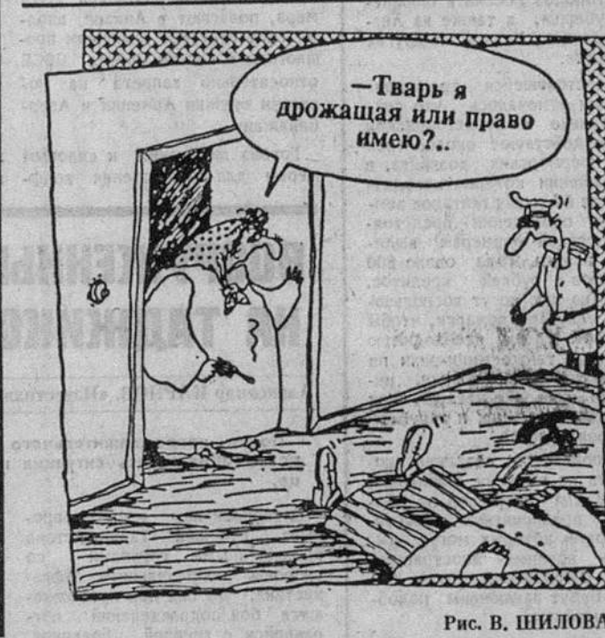
—Тварь я дрожащая или право имею?..