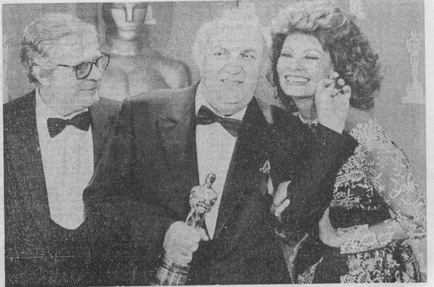
Итальянский кинорежиссер Федерико Феллини удостоен почетного «Оскара» за свою творческую деятельность.

Большоты чувствуют себя государственными чиновниками, в обиходе законодательства подрабатывающие в коммерческих структурах.