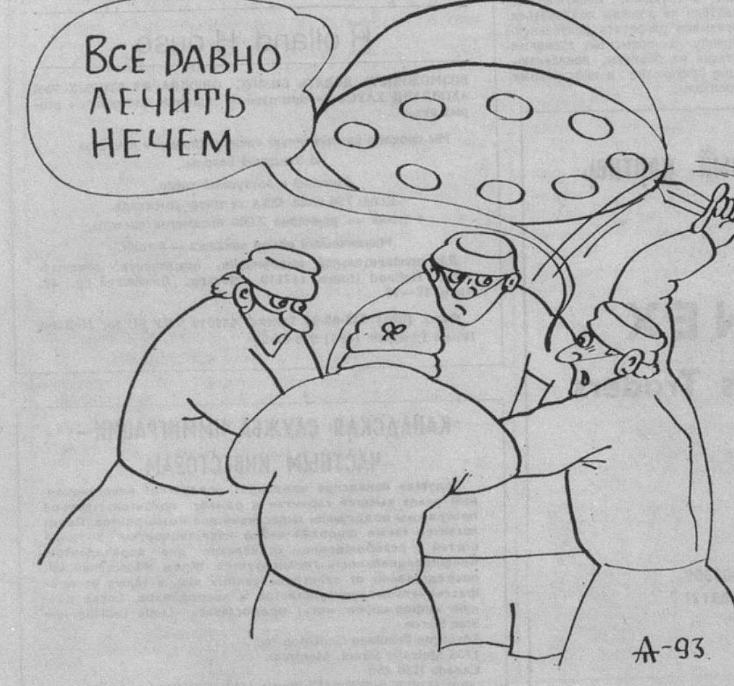
Рис. А. ТАЛИМОНОВА.