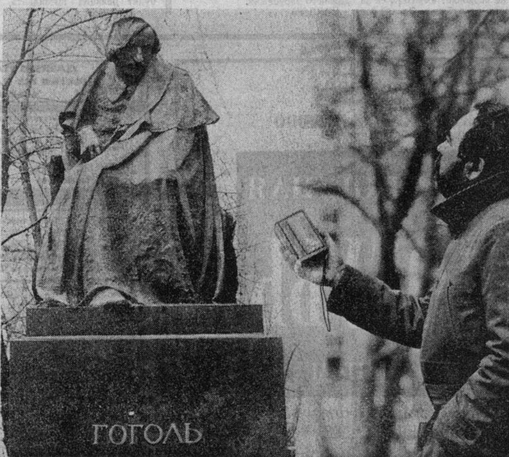
1 апреля памятник Николаю Васильевичу Гоголю любезно согласился дать эксклюзивное интервью корреспонденту «Известий», о чем вы можете прочесть на 7-й стр. в публикации «О чем молчал памятник Гоголю».

Рисунки А. ЗУДИНА, В. ЧУМАЧЕВА, В. БЕЛЯКИНА.