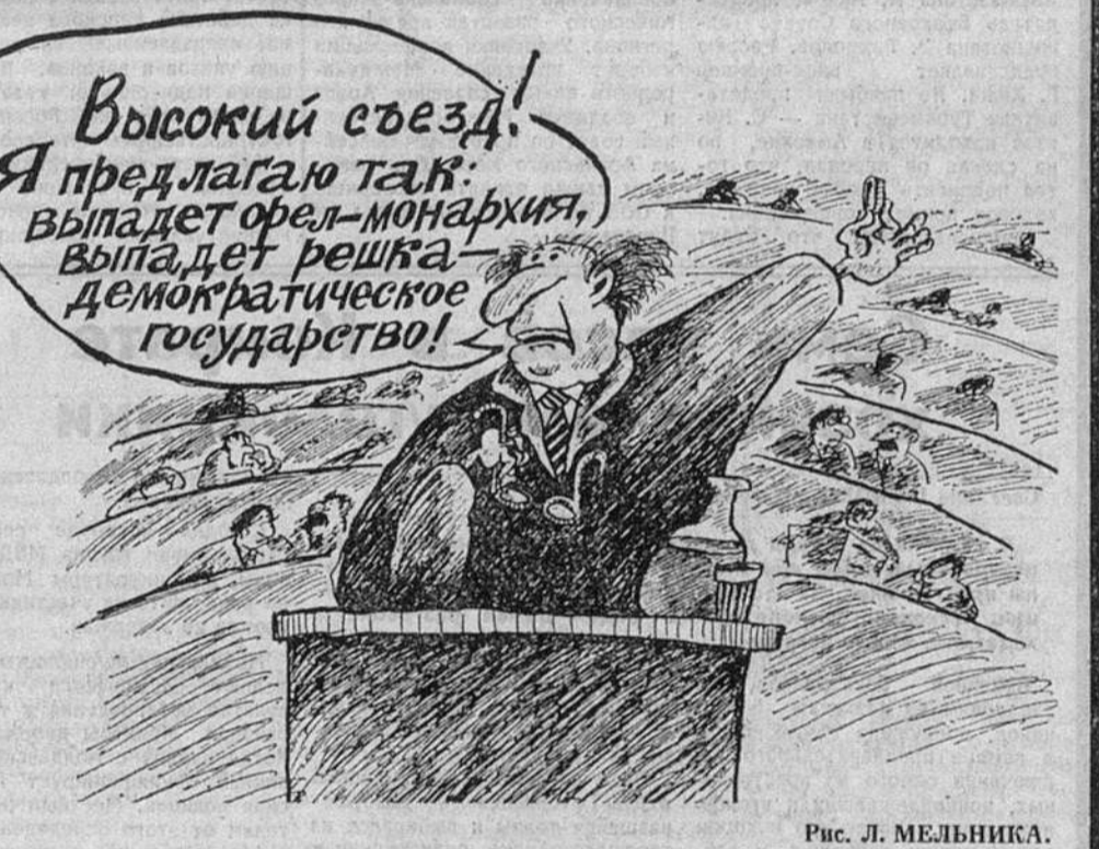
Рис. Л. МЕЛЬНИКА.

Виктор АСТАФЬЕВ. Другие мнения, связанные с нынешним противостоянием властей, читайте на 8-й странице.