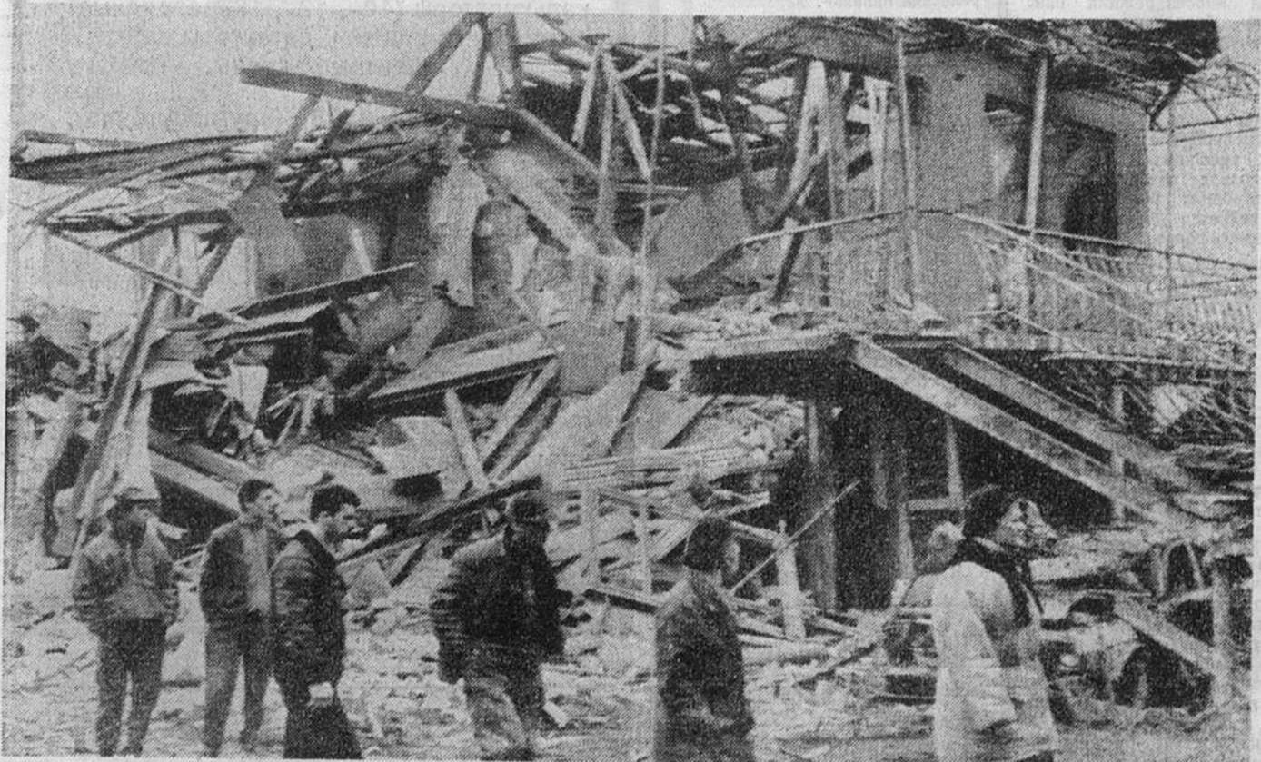
Бесик УГИГАШВИЛИ, «Известия»

Блицкриг Сухуми не удался. Грузинские войска, выдержав первый натиск, к полудню стабилизировали линию фронта, а чуть позже вернули прежние позиции.