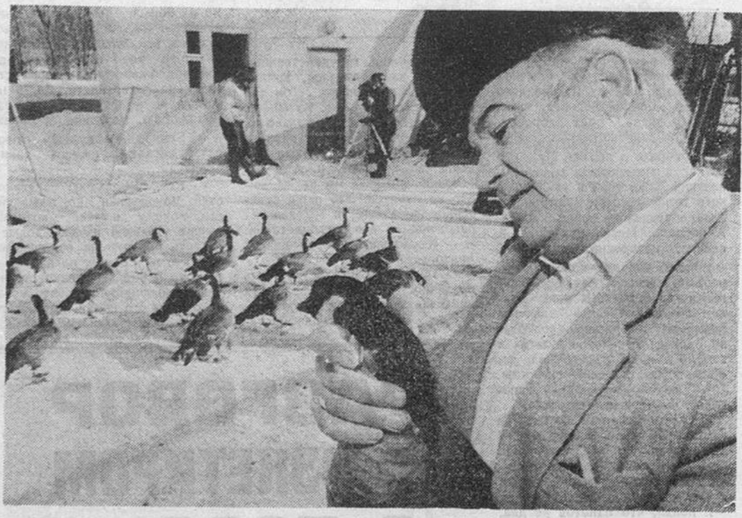
Камчатский институт природы присоединился к американско-японскому проекту по восстановлению популяции редкой птицы — алеутского гуса. Недавно партия таких гусей из Аляски (США) была доставлена на Камчатку для разведения.