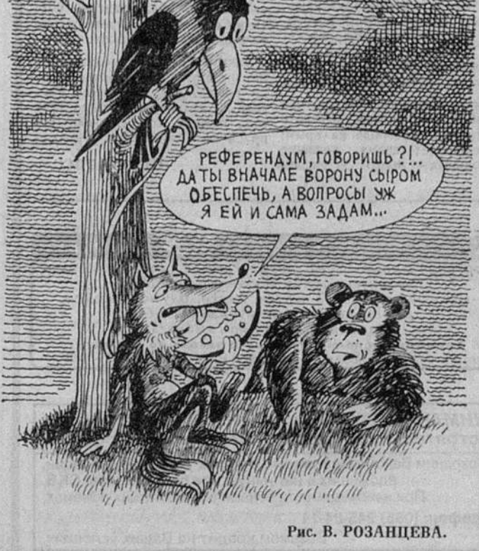
Рис. В. РОЗАНЦЕВА.