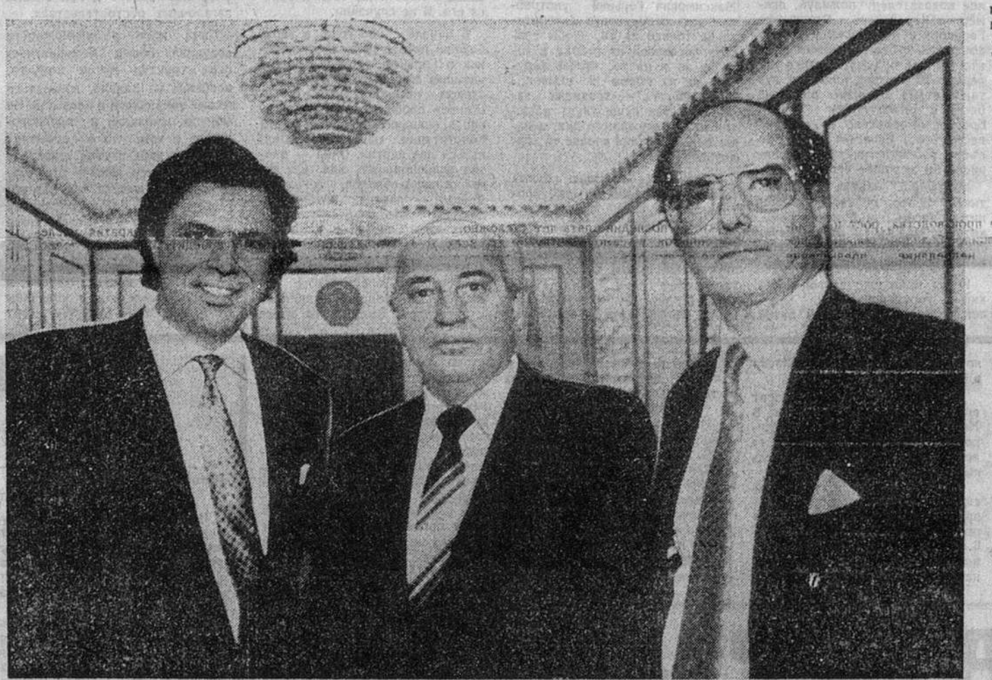
Майкл Бешлос, Михаил Горбачев и Струоб Тэлбот (слева направо) после интервью в Кремле 13 декабря 1991 года — за 12 дней до отставки первого и последнего президента СССР.

Буш сделал одно важное предупреждение, сидя рядом с советским генсеком на заднем сиденье длинного черного «Членовоза» ЗИЛ-114.