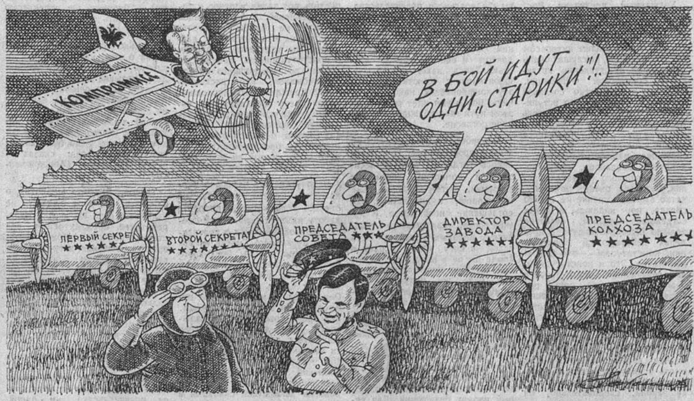
Рис. Валентина РОЗАНЦЕВА.