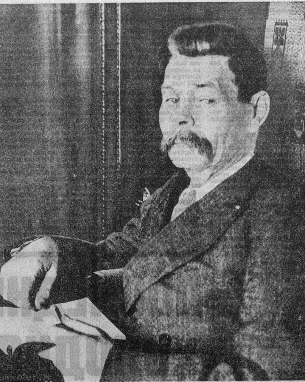
сам автор расценил как неудачу: «Клима» надо переделать с начала до конца».

Работая над «Жизнью Клима Самгина», Горький не смог противиться идеологическому прессингу тоталитаризма при осмыслении драмы интеллигенции. Не это ли стало источником внутренней драмы самого писателя в 30-е годы? К чести Горького, роман, вознесенный до небес официальной критикой,