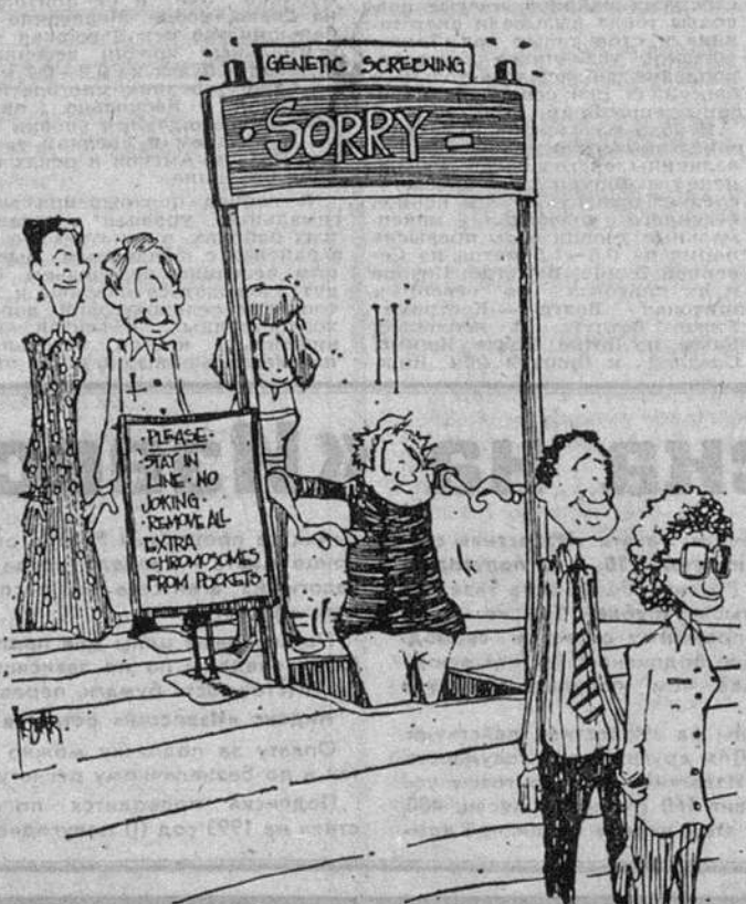
Перед тем как опуститься в некую установку генетического скрининга, от пациентов требуется: соблюдать очередь, никаких шуток, выбросить лишние хромосомы из карманов. На самой же установке единственное слово: «Извините».

Вопрос, который волнует не только генетиков, но и политиков