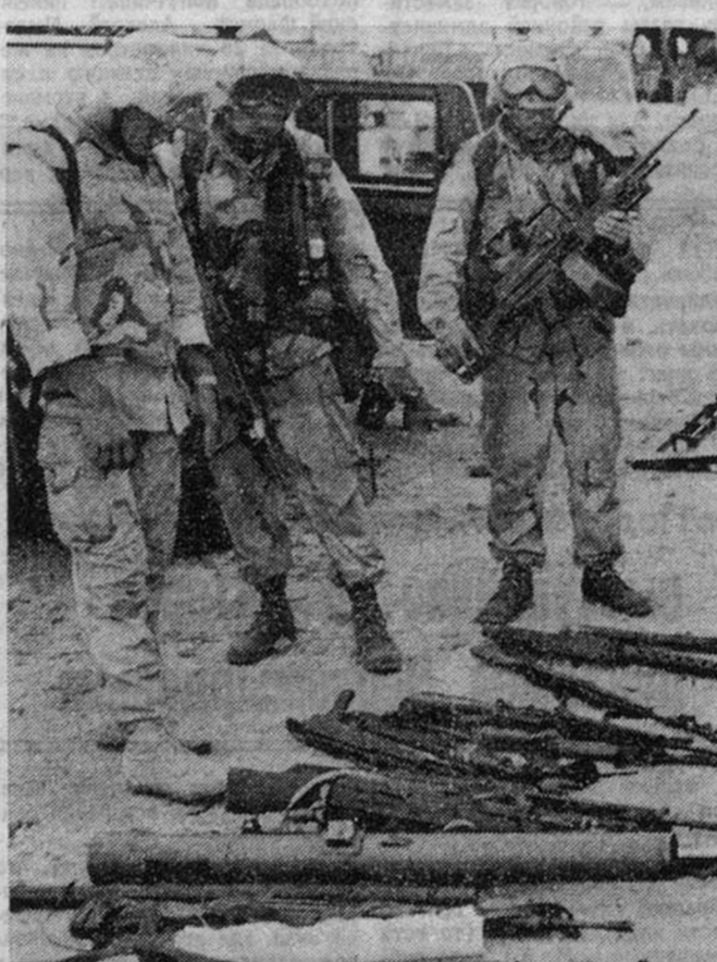
На снимке: морские пехотинцы США разглядывают захваченное ими оружие у группировки сомалийских боевиков под командованием генерала Мохамеда Фахаха Айдиды.