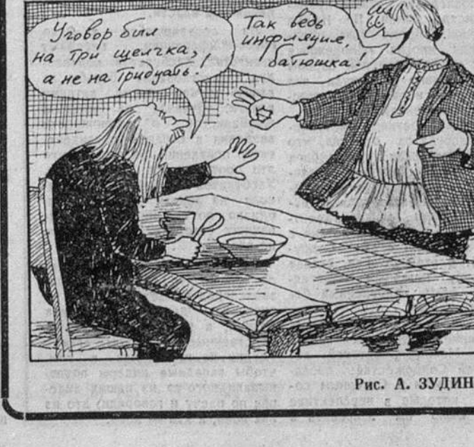
Рис. А. ЗУДИНА.