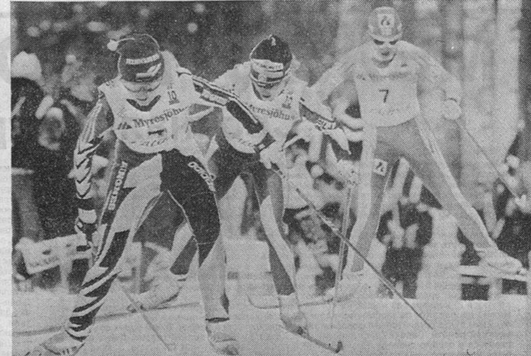
На редкость драматично прошла на чемпионате мира в шведском Фалуне женская лыжная гонка на 10 км свободным стилем, разделенная десятками долями секунды. Победила итальянка Стефания Бельмондо, второе и третье места заняли россиянки Лариса Лутина и Любовь Егорова.

МОСКОВСКАЯ ПРОГРАММА В телеканале «2-2»: 7.00 Новости. «Си-би-эс». 7.40, 10.45 и 20.30 Мультифильм. 8.00, 9.00 Новости «Би-би-си». 8.45 «Афиша». 8.50 «Зеленый карьерод». 10.00 Магазин «2Х2». 11.00 «Моя вторая мама». 107-я и 108-я серия. 11.55 Афиша. 12.30 Новости «Экспресс-реклама». 12.30 Новости «Ай-ти-эч». 12.00 «Шаргневая кожа». Спектакль. Часть 1-я. 14.45 Магазин «2Х2». 15.45 Огород — крупный дом. 16.30 «Шей-шью». 17.40 Афиша. 17.45 Новости «Би-би-си». 18.15 Московский теле-тайп. 18.20 Всегда с вами. Сбербанк России. 18.50 Подмосковье.