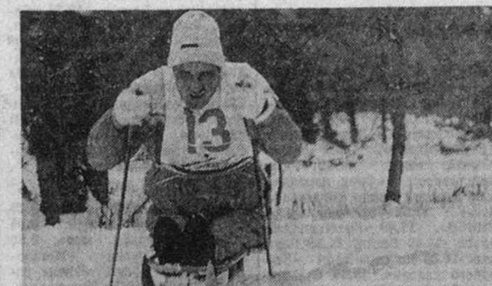
Только 30 человек из Красноярска, Перми, Екатеринбург, Братска, Чебоксар, Москвы и Литвы собрали лыжника Серебряного Бора в минувшие дни, но это были люди, преодолевшие страшный недуг — отсутствие ног. Пять километров для мужчин и два с половиной для женщин стали хоть маленькой,

На рисунке изображен маршрут движения Эрлинга Кагге.