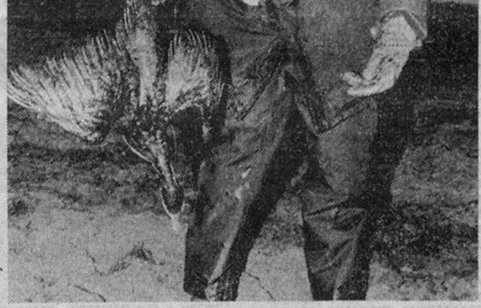
Авария танкера «Браер», натолкнувшегося на рифы близ Шетландских островов, стала и экологической катастрофой: гибнет животный мир, возникла опасность для здоровья людей.

Россия предоставит на платной основе 10 грузовых КамАЗов с 30 водителями и механиками для доставки гуманитарных грузов в Боснию и Герцеговину.