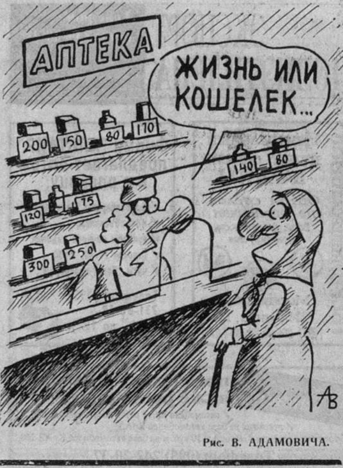
Рис. В. АДАМОВИЧА.