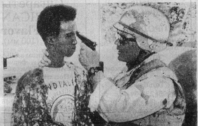
Солдаты многонациональных сил в Сомали продолжают находить у жителей оружие, которое тщательно утаивается и нередко пускается в ход. НА СНИМКЕ: американский морской пехотинец направил на 15-летнего сомалийца отобранный у него пистолет.

Правительство Швеции официально объявило, что по иностранным подводным лодкам, тайно входящим в ее территориальные воды, впрямь будет открываться огонь.