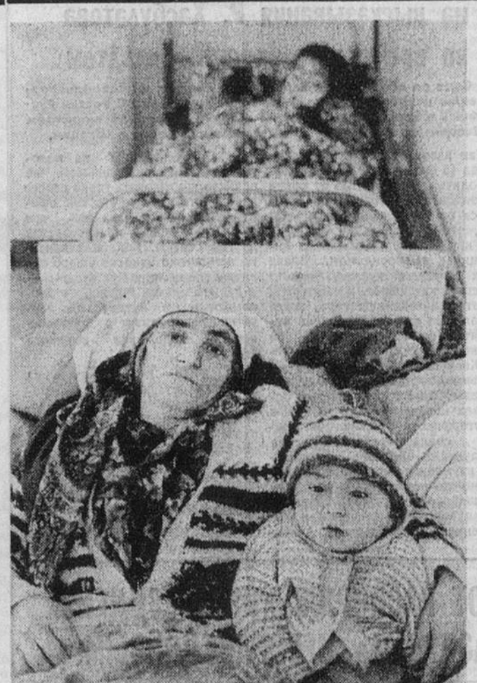
Возвращающимся из Афганистана таджикским беженцам зачастую требуется оказывать медицинскую помощь в приграничной больнице.

Пока могу сказать одно, заявил генерал. Я только что разговаривал с командиром дивизии. Он доложил, что никаких скопления отрядов гвардейцев возле частей его соединения нет. Обстановка в целом спокойная. Но необходимые мероприятия для защиты воинских складов, казарм и других армейских помещений тем не менее проводятся. По информации, которой располагает редакция, нападения на российские воинские части в Грузии практически не прекращаются. Вот последние факты. В Тбилиси ограблен склад технических средств проаганды группы войск в Закавказье. Угнаны 4 спецавтомобиля и автобус, вывезено в неизвестном направлении большое количество фотоаппаратов, радиоприемников, кинопроекторов, телевизоров. Другого культурно-просветительского. Военная полиция Минобороны Грузии обстреляла российский грузовик, высадил из него водителя и угнала автомашину.