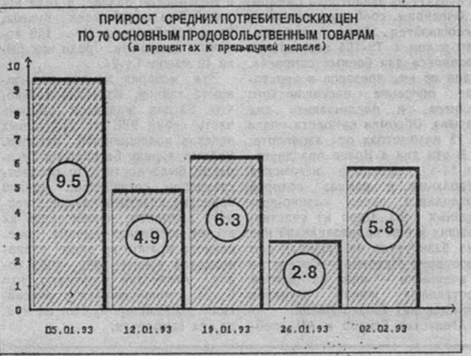
ПРИРОСТ СРЕДНИХ РОЗНИЧНЫХ ЦЕН ПО ТОВАРАМ ОСНОВНОГО ПРОЖИТОЧНОГО МИНИМУМА (в процентах к предыдущей неделе)

Дороже всего 2 февраля этот набор продуктов стоил в Южно-Сахалинске — 9,408 рублей в расчете на месяц, в Комсомольске-на-Амуре — 8,666 рублей, в Москве — 6,038 рублей. В перечне самых дорогих городов Москва занимает 6-е место, Санкт-Петербург — 42-е из 132 городов.