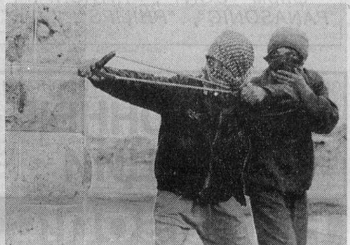
После недавнего убийства в Иерусалиме 16-летнего палестинца обстановка здесь стала еще более взрывоопасной. На снимке: юные палестинцы стреляют из рогатки в направлении израильского полицейского поста.