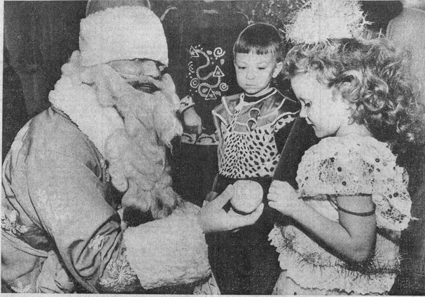
мамами и папами малышей.

Как и в прошлом году, как и, впрочем, ежедневно, средняя не праздничная выделенная основная посылка «Соучастия» — Автобанк. А вот кооператив «Агаргар» устроил детям и их родителям чай с пирогами, позаботился о транспорте.