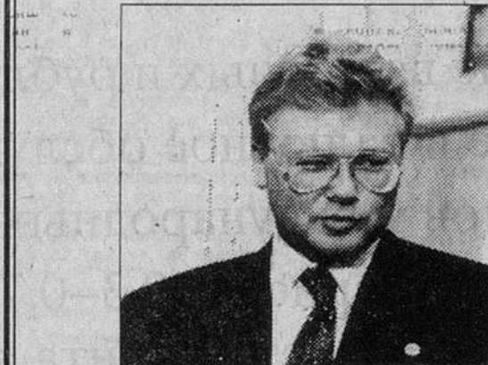
Владимир СКОСЫРЕВ. «Известия»