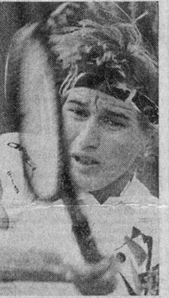
то выбор. Прежде всего хочу попустироваться...

— Ты счастлива? — Ммм... Да, почти. Жаль только, нет времени воспользоваться своим счастьем.