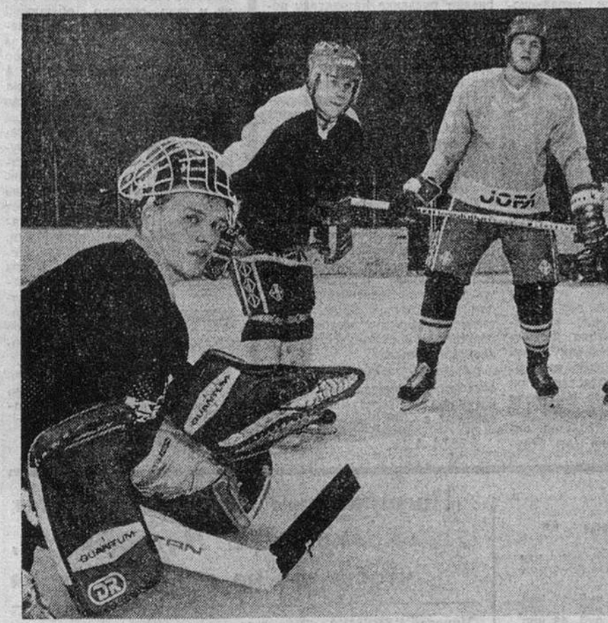
Тренируется олимпийская сборная России.

Он разыгрывается в 26-й раз... 15 декабря в Лужниках откроют турнир четырьмя матчами. Во Дворце спорта, где предстоит играть группе «А», днем встретятся сборные Норвегии и Чехии, вечером — США и первой команды России. На Малой арене первыми выйдут на лед хоккеисты Беларуси и олимпийской сборной России, а уж вслед за ними сборная Франции, в которой, как известно, есть и кандидат французского происхождения, померится силами с командой Канады.