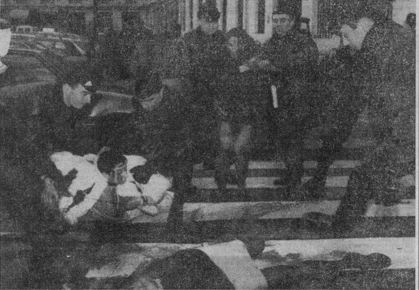
Активисты из общества защиты животных в Париже устроили сидячую демонстрацию напротив крупнейшего во французской столице салона мехов, протестуя против «бесчеловечного отношения к черной кошке и песцам». Местная полиция восстановила порядок на тротуаре, арестовав несколько наиболее активных демонстрантов.