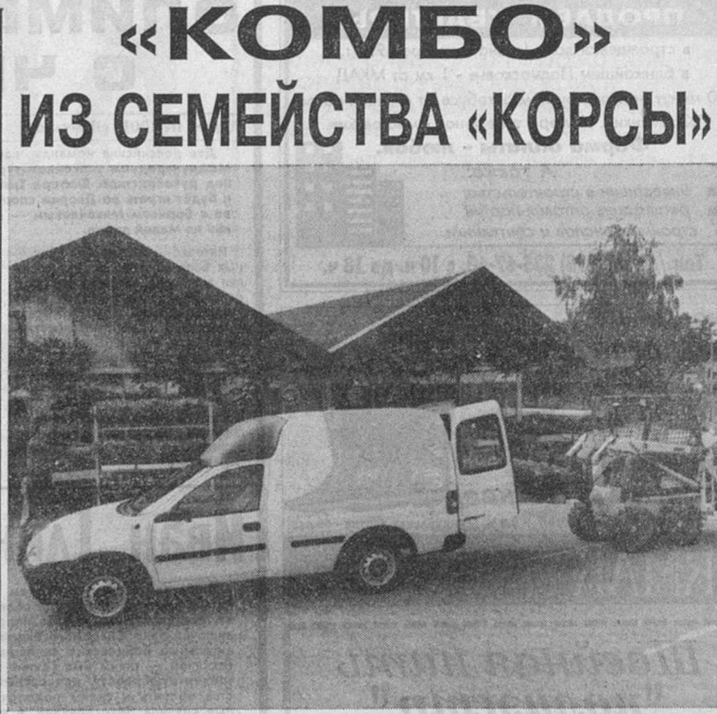
Сергей АБВОВ, «Известия»

По данным «Дженерал моторс», семейство «Корсы» обещает стать рекордно популярным в Европе. В секторе продаж компактных автомобилей модель «Корса», дебютировавшая на рынке в апреле 1993 года, находится в первой тройке лидирующих моделей в 11 странах. Она на первом месте по продажам в Германии (с апреля по сентябрь — 40 тысяч единиц). Все го хозяевам новой «Корсы» стали уже свыше 320 тысяч человек.