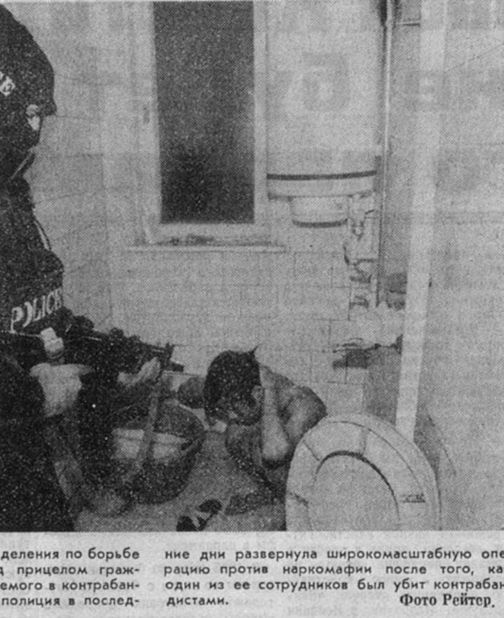
В Софии боец спецподразделения по борьбе с терроризмом держит под прицелом гражданина Вьетнама, подозреваемого в контрабанде наркотиков. Болгарская полиция в последние дни развернула широкомасштабную операцию против наркомафии после того, как один из ее сотрудников был убит контрабандистами.