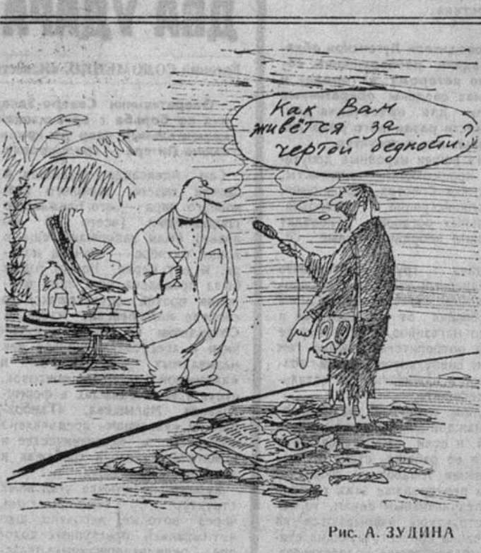
Рис. А. ЗУДИНА