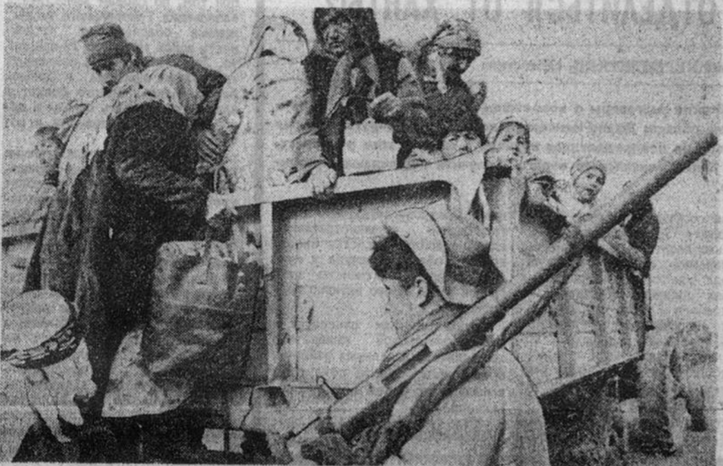
Проблема беженцев в Таджикистане стоит особенно остро. В результате вооруженного противостояния между различными политическими группировками тысячи жителей республики покинули обжитые места. На снимке: беженцы под городом Кумсангир.