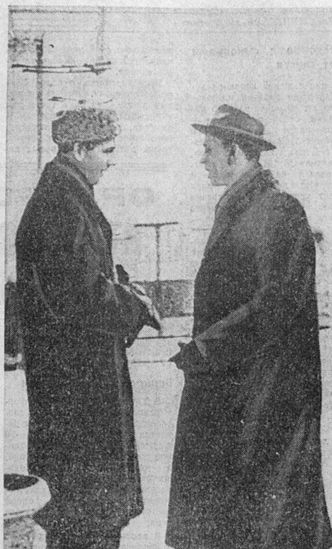
На этом снимке, публикуемом впервые, Ли Харви Освальд — слева, в шапке. Он понятия не имел, что его снимала велась сотрудниками «наружки» белорусского УКГБ. Зима 1961 года.

В разговоре, который мой коллега, Валерий Костиков, и я вели с Освальдом и который продолжался почти час, настроение американца все время менялось: иногда он походил и жутко возбужденное состояние, был как-то то переменим. Явный инстинкт... Он заявил, что его