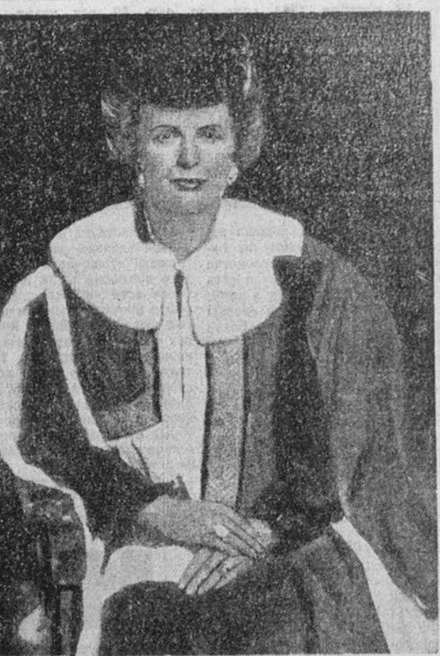
На снимке: Мэргарет Тэтчер стала 6 июня 1992 года баронессой Кестивен.

— Эта организация, которая пыталась заменить бомбами избирательные бюллетени, хочет