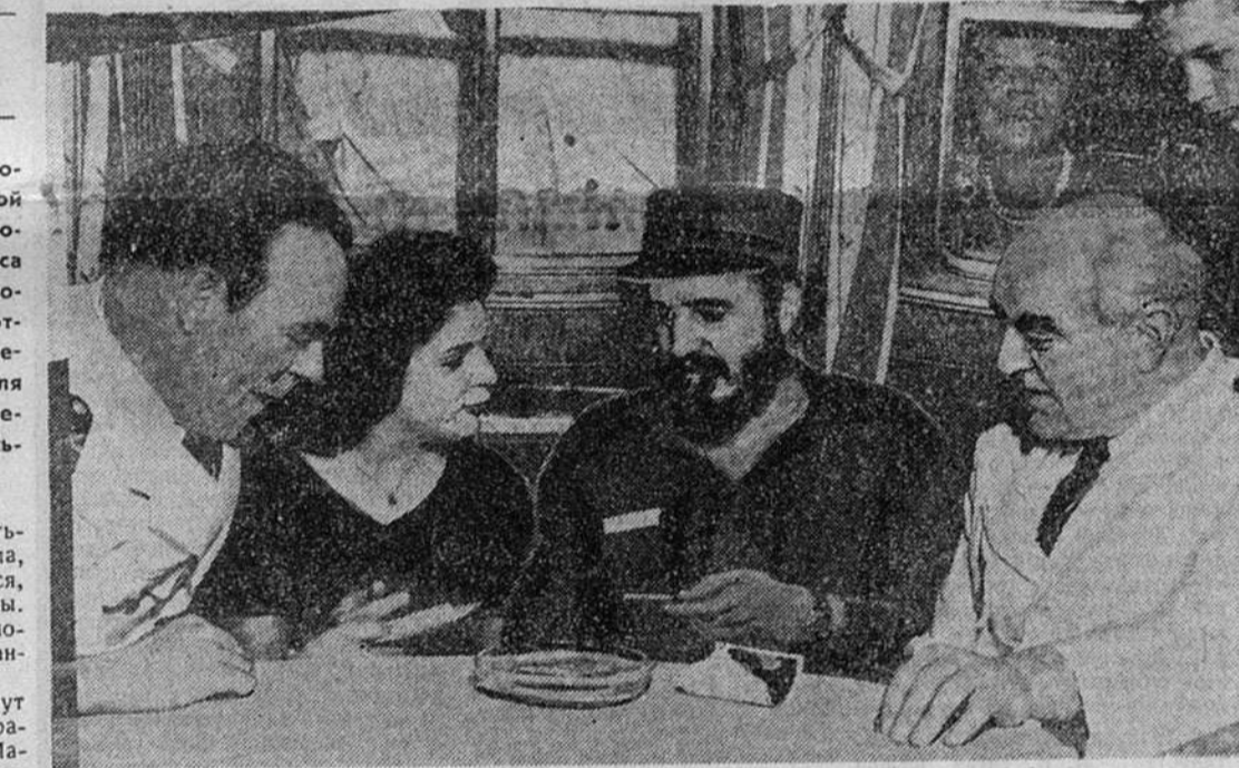
На снимке: Марита Лоренц и Фидель Кастро на борту теплохода «Берлин» — любовь с первого взгляда.

— В апреле 1959 года Фидель Кастро прилетел в США, чтобы встретиться с президентом Эйзенхауэром и урегулировать отношения между двумя странами.