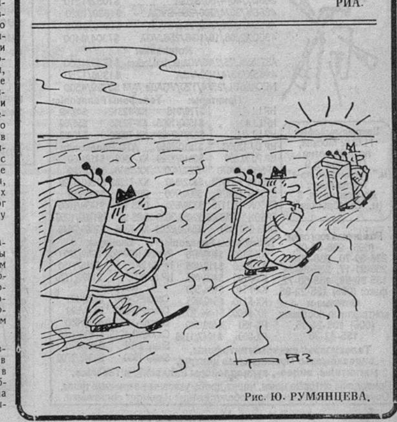
Рис. Ю. РУМЯНЦЕВА.