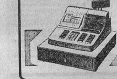
CE-2300 Контрольная и чековая лента. 5-15 купюрных секций. 200 программируемых кодов цены. Большой дисплей на жидких кристаллах. 4 кассира. Расчет НДС.

Контрольная и чековая лента. 5-15 купюрных секций. 200 программируемых кодов цены. Большой дисплей на жидких кристаллах. 4 кассира. Расчет НДС.