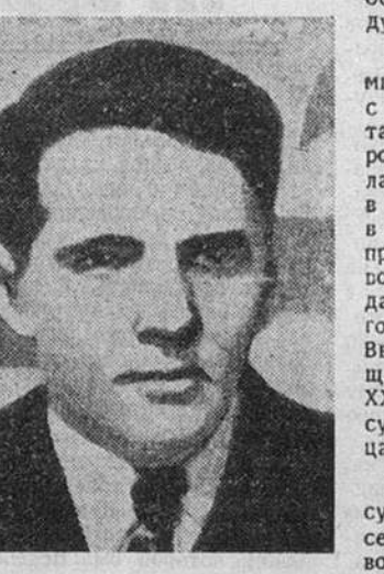
Александр Введенский. Снимок конца 30-х годов (архив).