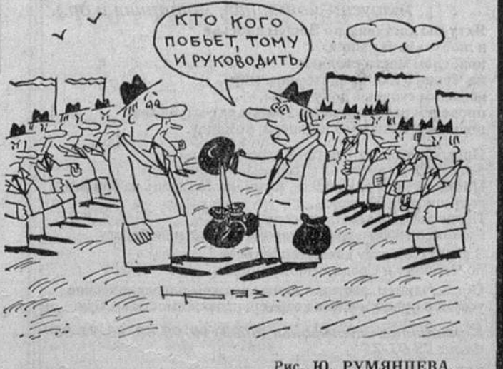
Рис. Ю. РУМЯНЦЕВА.