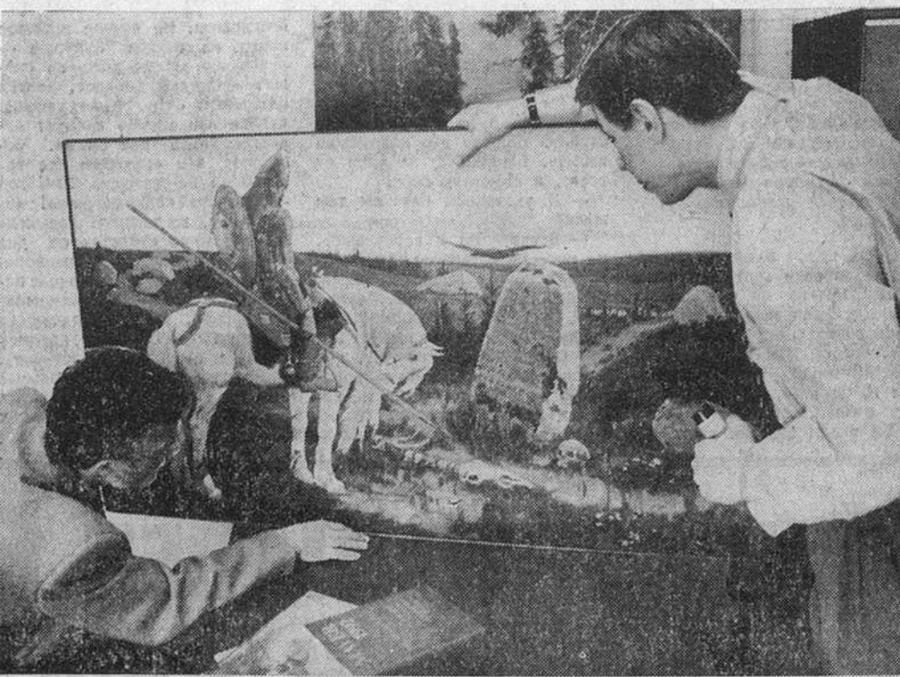
Васнецовский «Витязь на распутье» — третий авторский вариант знаменитого полотна. Картина станет «возвездом» предстоящего сентябрьского аукциона «Альфа-арт» в Центральном доме художника на Крымском валу.