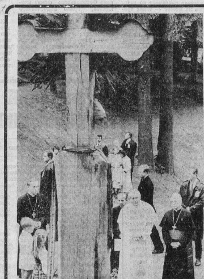
Во время пребывания в Литве папа Иоанн Павел II посетил мемориал, воздвигнутый в честь погибших в 1991 году участников движения за независимость Литвы.

Материал о визите — на 2-й стр.