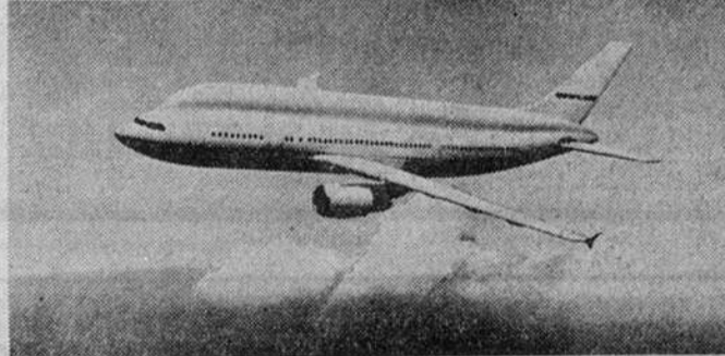
Лайнер «Криолан», в создании которого совместно участвуют российские и германские специалисты.

На летном поле в Жуковском было мало образцов иностранной крылатой техники. Возмужало, это и к лучшему для показа уровня отечественного авиационного, а главное, для окончательного оформления в тиши московских офисов и представительств долго вызревавших деловых договоренностей. Например, обретенный как бы второе дыхание и динамика «Авиаэкспорт» завершил наработки, начатые год назад в Фарнборо, затем продолженные летом в Бурже. Заключе-