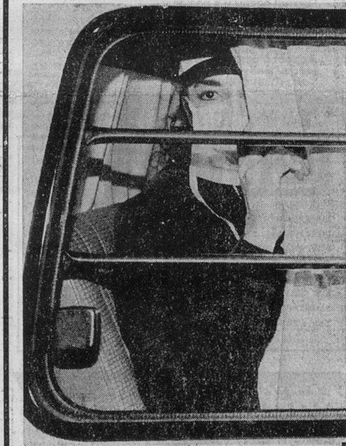
По сообщениям информационных агентств, суперзвезда американской поп-музыки Майкл Джексон отдыхает в отеле после того, как он потерял сознание перед началом второго концерта в Сингапуре.

Их разведывательный самолет был сбит советскими истребителями.