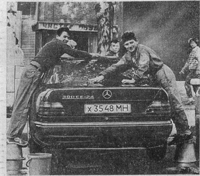
Сергей МОСТОВЩИКОВ, «Известия»

1 сентября к детям моей страны принято было обращаться со стихотворением «Дети, в школу собирайтесь, петушок пропел давно», после чего давали им традиционный Урок Мира с повествованием о количестве крылатых ракет потенциального противника. Сейчас петушок вводит неудачно, а крылатые ракеты мало кого интересуют. Поэтому накануне Дня Знаний было решено выйти на улицу непосредственно к детям и просто посмотреть, в чем теперь выражается процесс тяги молодого поколения к знаниям.