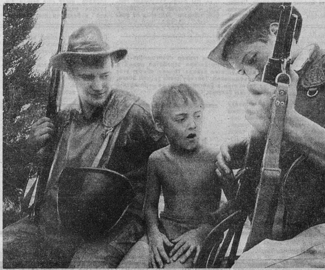
В Пянджском погранотряде офицерские дети лето проводят так же, как и остальные времена года — среди солдат и оружия.

Боец во влажном «хэбэ» — пограничник временный. Он и группа его товарищей пригнаны 8-й заставе для усиления из 201-й мотострелковой дивизии. После обострения ситуации на границе такие группы — с бронетехникой, со всем необходимым вооружением и достаточным комплектом боеприпасов направлены практически на все тре-