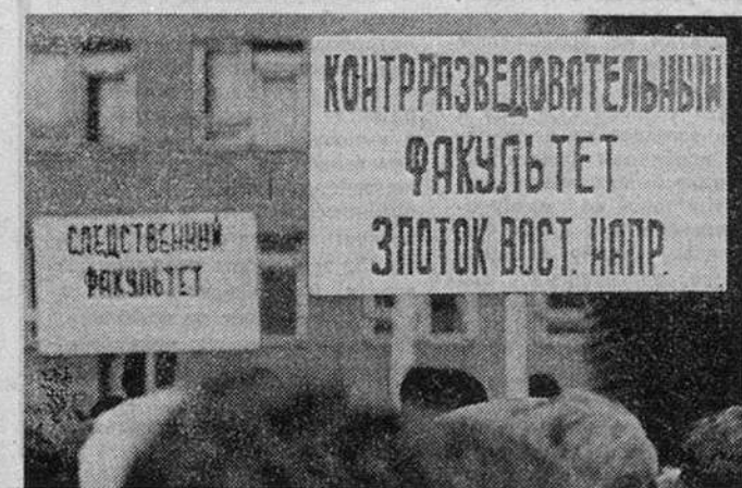
Виктор ЛИТОВКИН, Владимир МАШАТИН (фото), «Известия»

Приняли военную присягу на верность России восемьсот первокурсников Академии Министерства безопасности. 24 августа ей исполняется ровно год от роду.