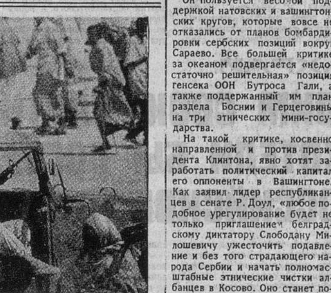
Обстановка в Сомали сравнима с гитлеровской троицей, в которой с каждым днем все глубже уязвляет гуманитарная операция ООН. Как пишет обозреватель газеты «Таймс» от Индия, «оружие и боеприпасы, время и инициатива», которыми располагают сомалийские партизаны, позволяют им беспрепятственно наносить удары и скрываться. Уличные бои стали каждодневным явлением. Отношение местного населения, несмотря на его огромные страдания и беды, перенесенные по вине враждующих племенных баронов, к контингенту ООН «далеко не дружественное».