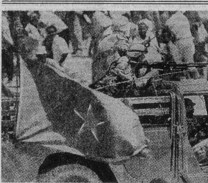
Обстановка в Сомали сравнима с гитлеровской троицей, в которой с каждым днем все глубже уязвляет гуманитарная операция ООН. Как пишет обозреватель газеты «Таймс» от Индия, «оружие и боеприпасы, время и инициатива», которыми располагают сомалийские партизаны, позволяют им беспрепятственно наносить удары и скрываться. Уличные бои стали каждодневным явлением. Отношение местного населения, несмотря на его огромные страдания и беды, перенесенные по вине враждующих племенных баронов, к контингенту ООН «далеко не дружественное».