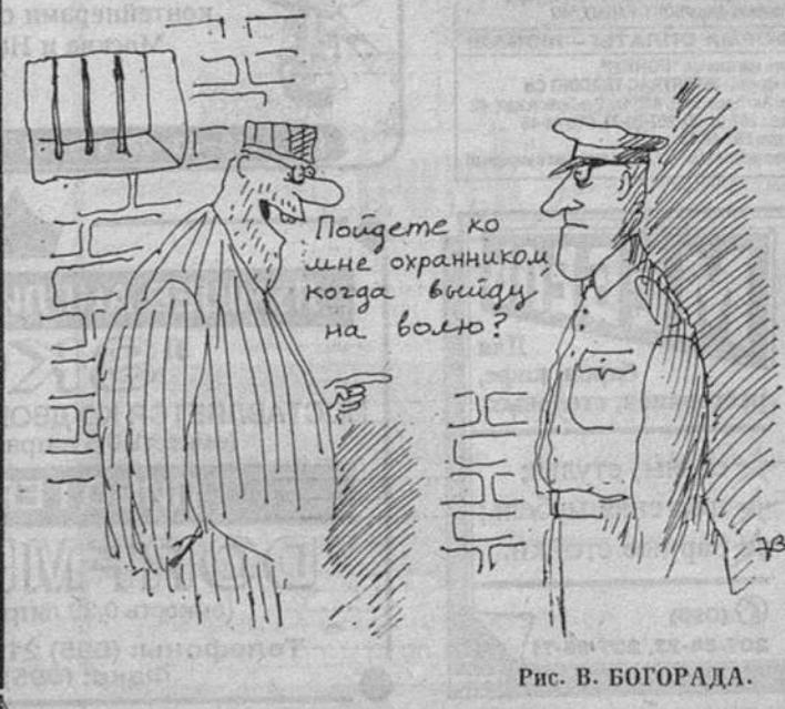
Рис. В. БОГОРАДА.