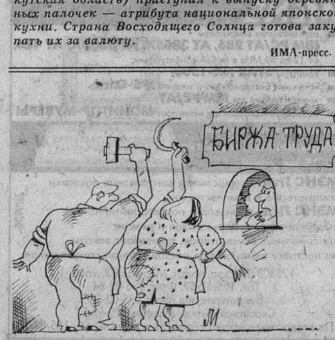
Рис. И. ЛЕВИТИНА.