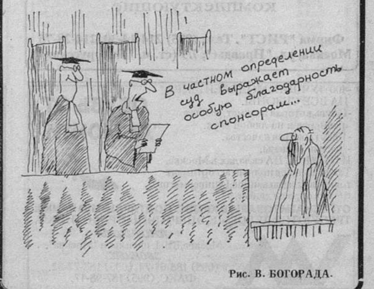
Рис. В. БОГОРАДА.

30 боевых гранат вместе с покупателями и продавцами этого опасного товара захватили в центре столицы Кыргызстана сотрудники Госкомитета национальной безопасности республики. По предварительным данным, боеприпасы завезены в Бишкек из Казахстана, где были похищены из воинской части. Возбуждено уголовное дело. ИТАР—ТАСС.